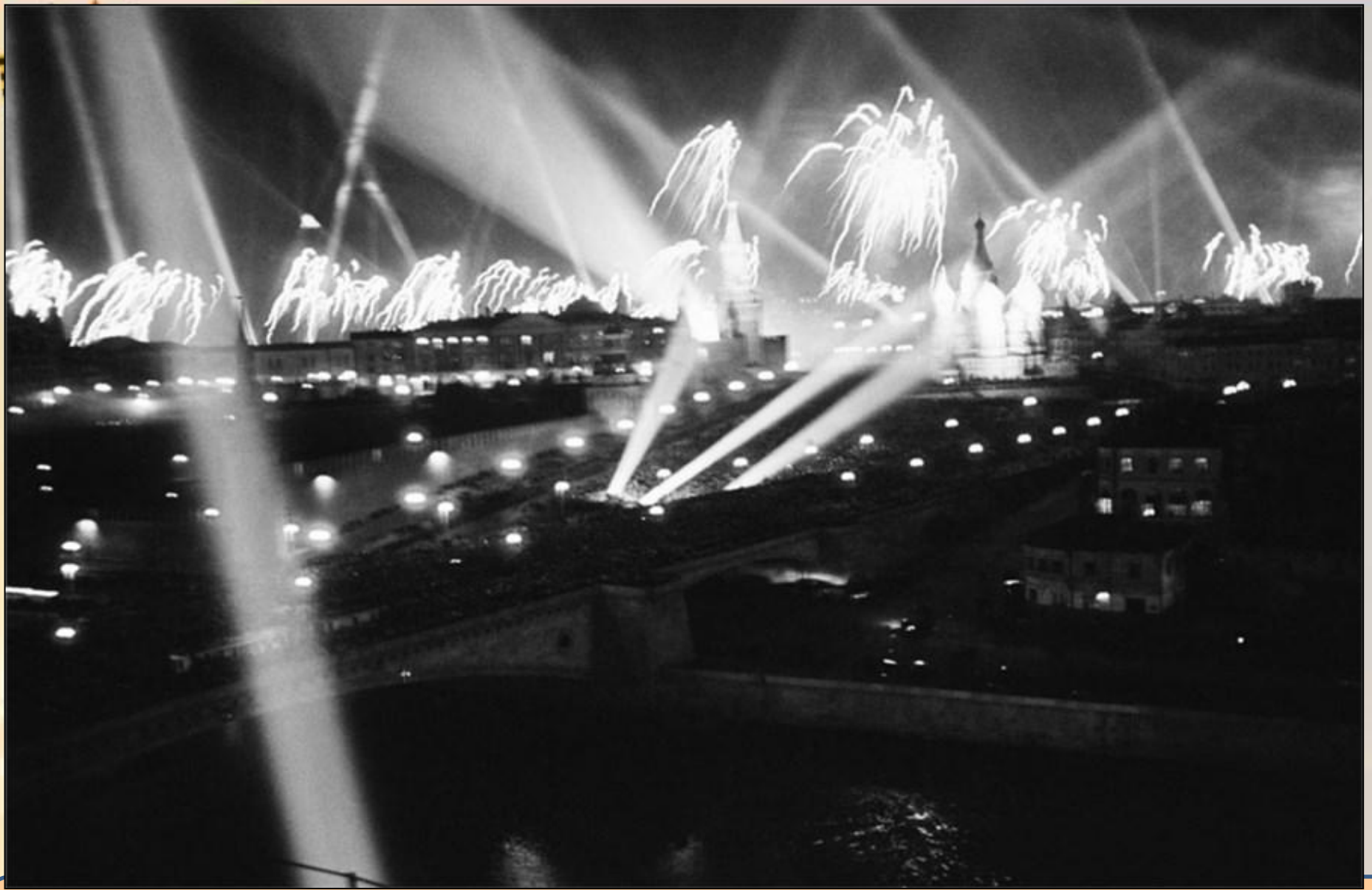
Празднование победы на Красной площади в Москве. Фейерверки, артиллерийский салют и иллюминация 9 мая 1945 года.