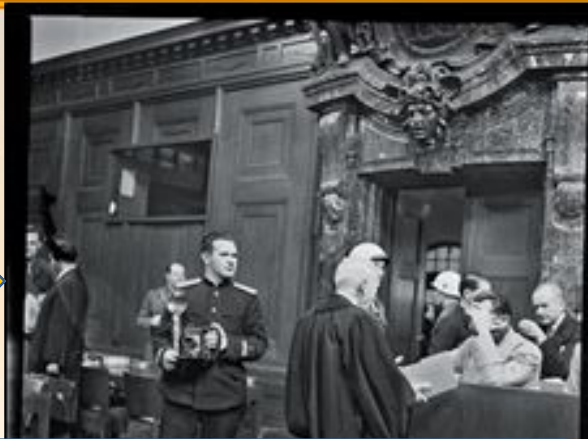
Фотограф Е.А. Халдей на Нюрнбергском процессе недалеко от Геринга

На его снимках запечатлено поражение японцев на Дальнем Востоке, Парижское совещание министров иностранных дел и подписание акта капитуляции Германии. Именно он на поверженном Рейхстаге в Берлине снял Знамя Победы, ставшее символом победы советского народа в Великой Отечественной войне.