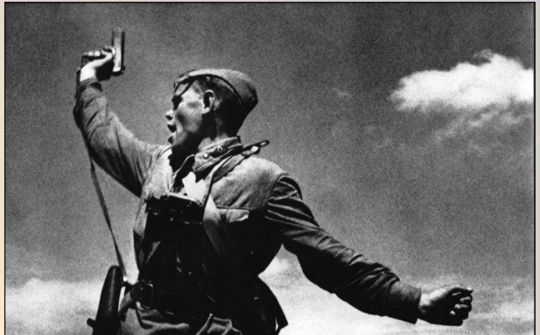
Фото было сделано 12 июля 1942 года около села Хорошее (Славяносербский район Луганской области) между реками Лугань и Лозовая на участке, где держал оборону 220-й стрелковый полк 4-й стрелковой дивизии, ведя упорные кровопролитные оборонительные бои с превосходящими силами противника.