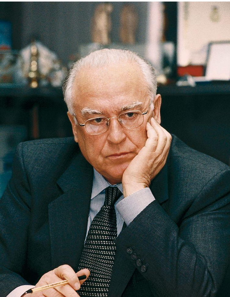
Черномырдин Виктор Степанович (1938-2010 гг.) – премьер-министр