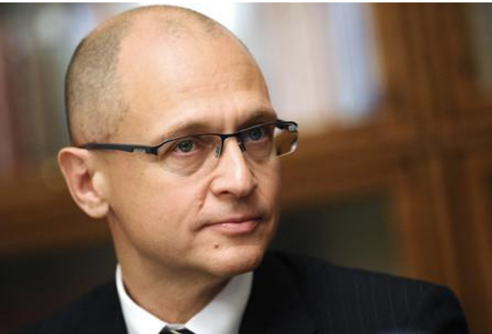
Кириенко Сергей Владиленович (родился 26 июля 1962 г.) – председатель правительства