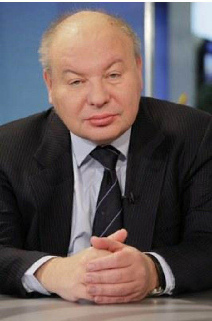
Гайдар Егор Тимурович (1956-2009 гг.) – Председатель правительства