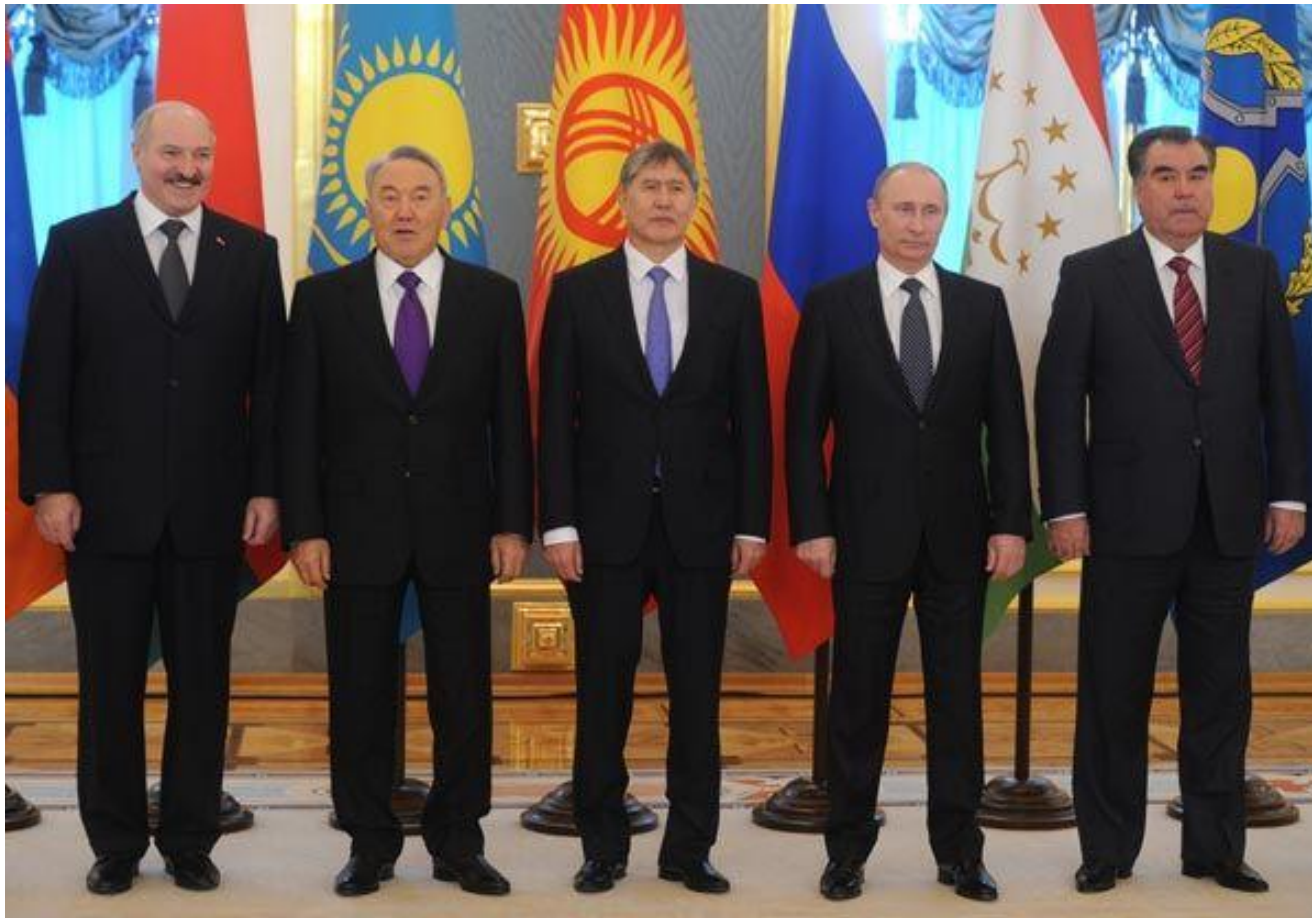
(А.Г. Лукашенко, Н.А. Назарбаев, А.Ш. Атамбаев, В.В. Путин, Р. Эмомали)