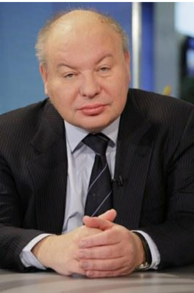
Гайдар Егор Тимурович (1956-2009 гг.) – Председатель правительства