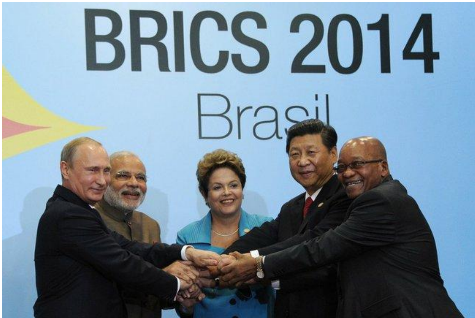
Лидеры стран БРИКС на саммите в 2014 году (В. Путин, Пранаб Кумар Мукерджи, Дилма Русеф, Си Цзиньпин Джэйкоб Зума)