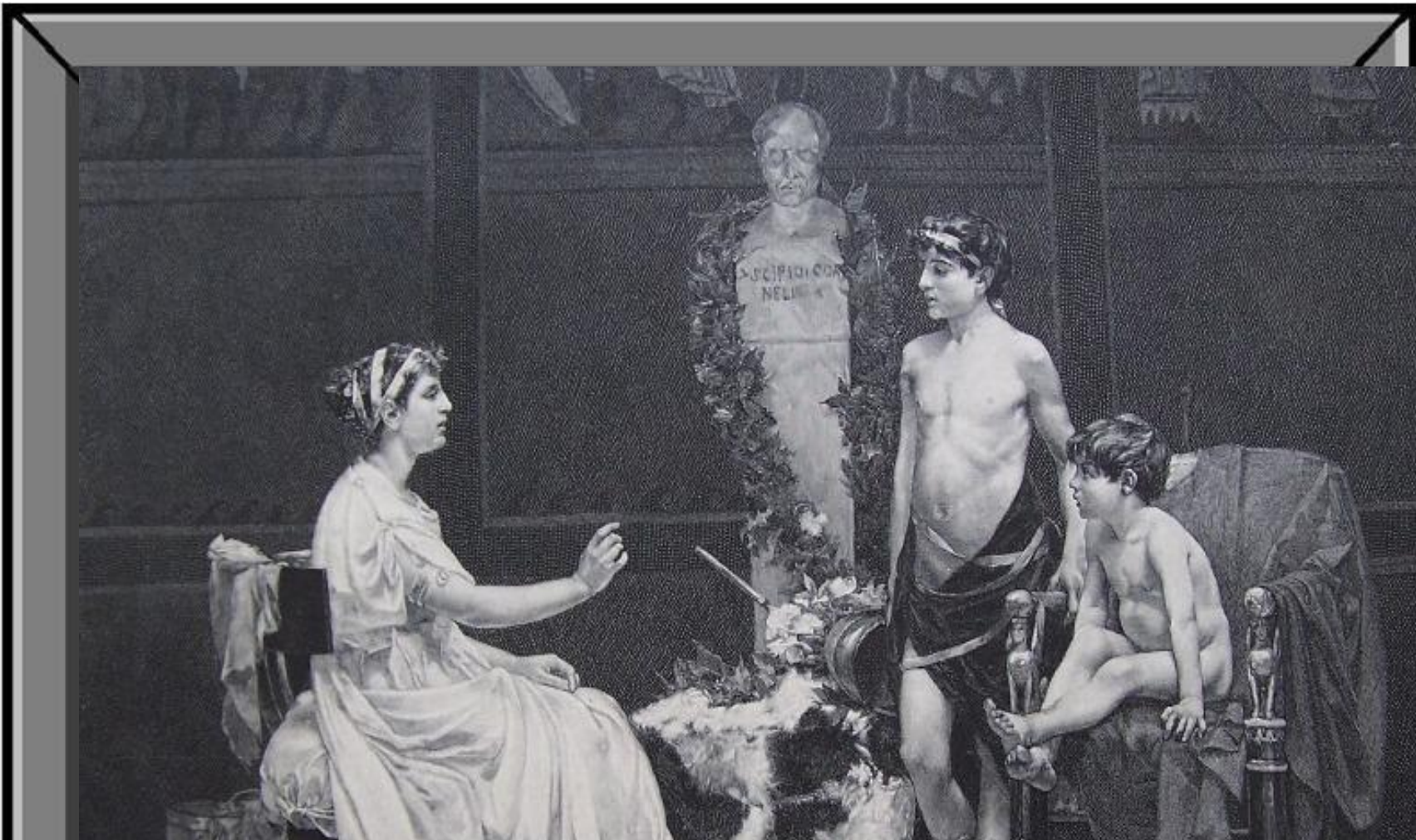
Братья Гракхи в детстве с матерью Корнелией Африканской Младшей