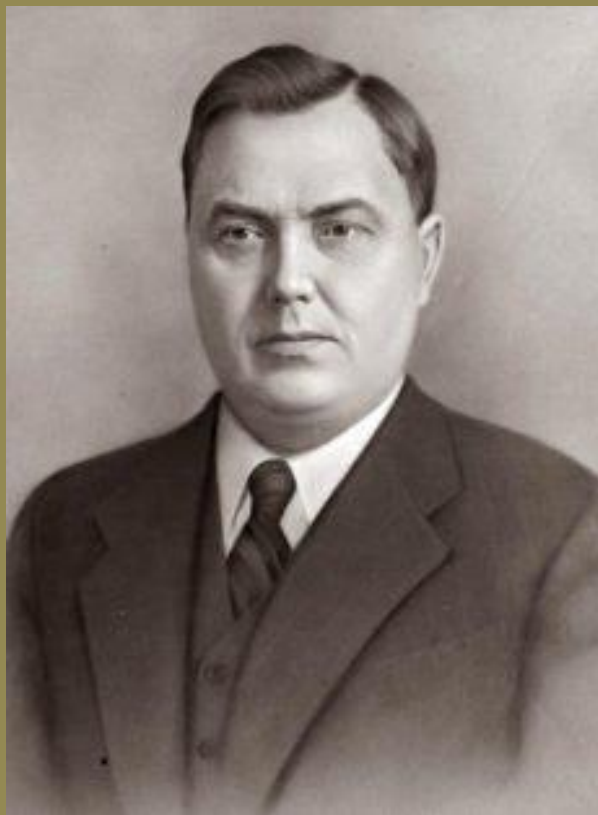
Г.М.Маленков – Председатель Совета Министров СССР.