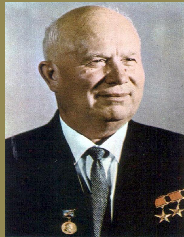
Н.С.Хрущев – секретарь ЦК КПСС.