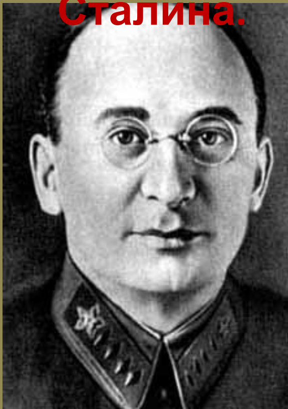
Л.П.Берия –первый зам. предсовмина, вновь возглавил МВД.