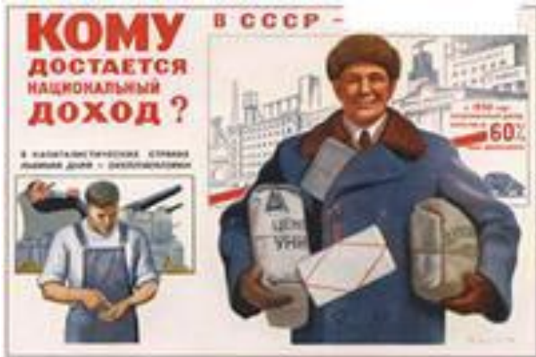
125. Говорков В. Кому достаётся национальный доход? 1950.