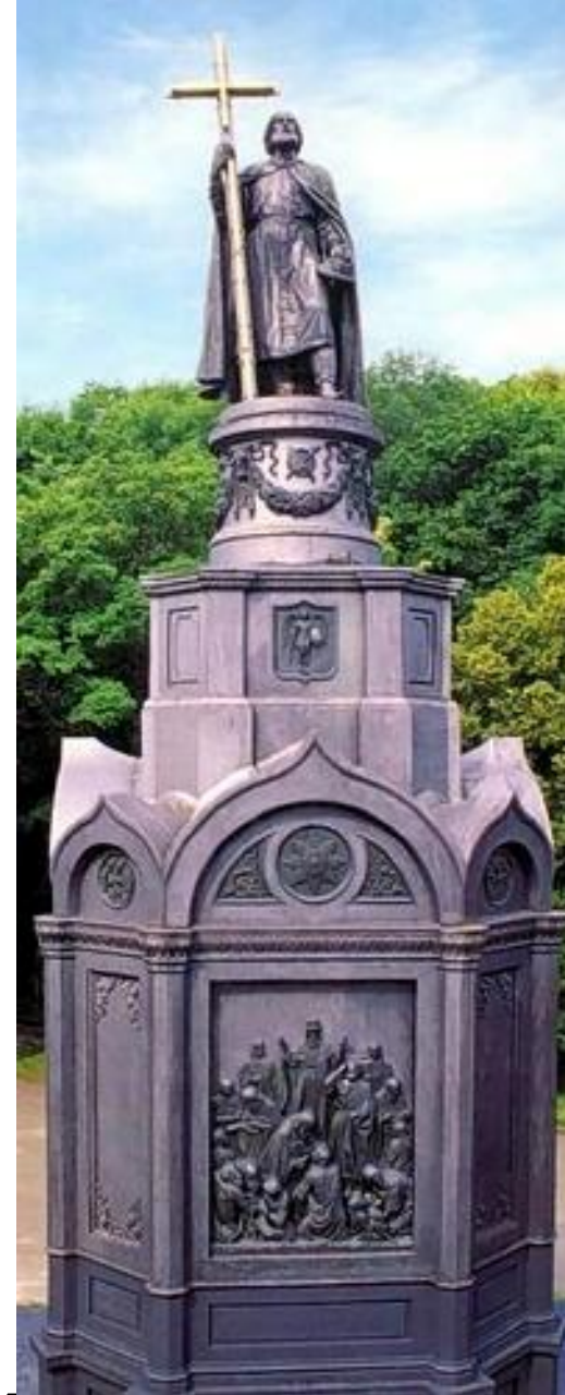
Пам'ятник князю Володимирі в Києві