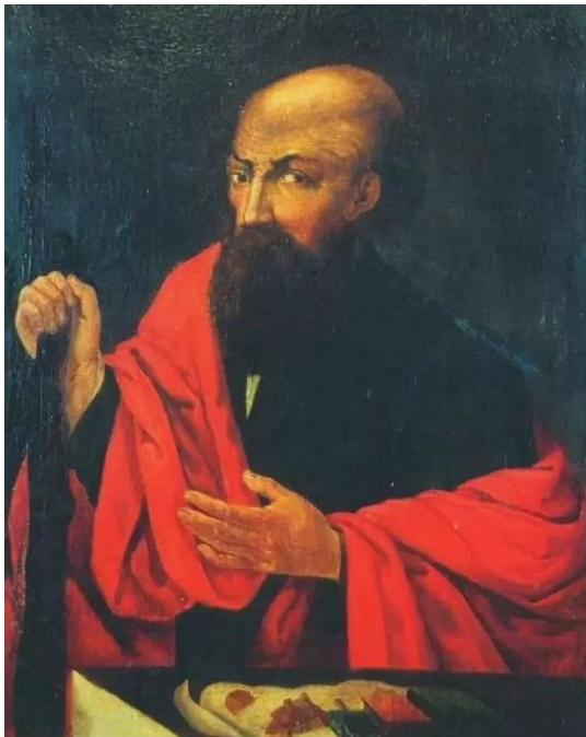
Н.Д. Демидов. Портрет

Задание: прочитайте п. I. Приведите не менее трех фактов, свидетельствующих о том, что государство при Петре I играло значительную роль в экономике России.