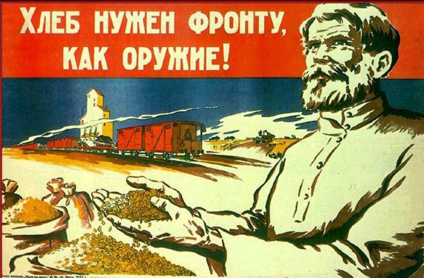
Плакат Л.И.Дешко. 1943 г.