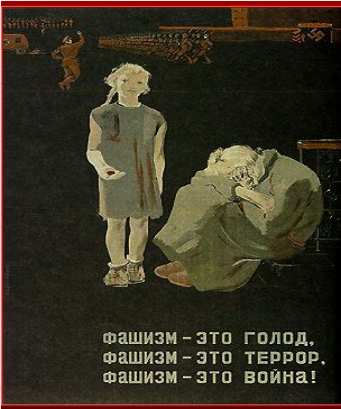
Плакат П. Караченцов а 1937 г.