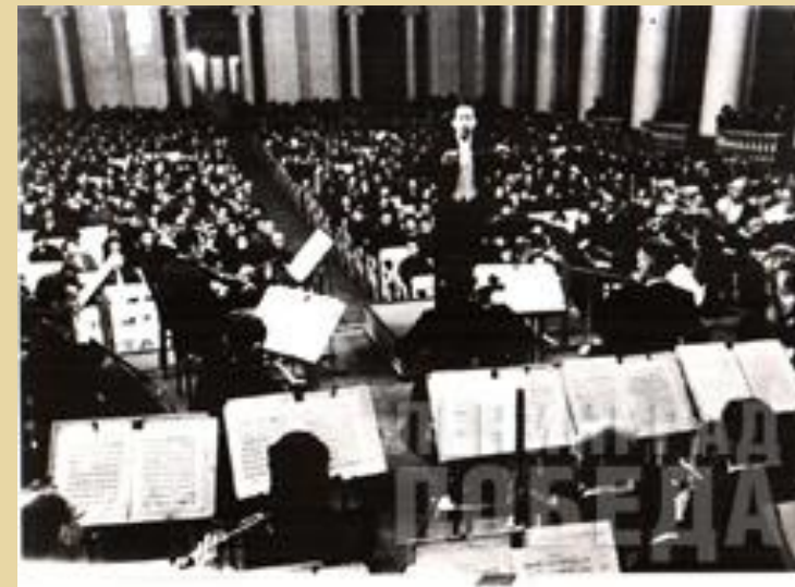
Возобновление концертов в Филармонии. 1 мая 1942 г.

2 июля «Ленинградская правда» сообщила о доставленной с Урала в Ленинград самолетом партитуре Седьмой (Ленинградской) симфонии Дмитрия Шостаковича и о предстоящем ее исполнении. Оно состоялось 9 августа в Филармонии и транслировалось по радио, ее слушали жители города и бойцы на фронте... Этот концерт в блокадном городе получил всемирный резонанс.