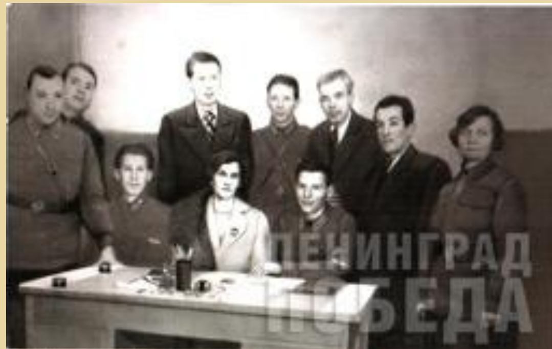
Мастера искусств в Кронштадте. Январь 1942 г.

В те же дни бригада мастеров искусств была направлена в Кронштадт: там артисты могли не только выступить, но и, как тогда говорили, «подкормиться» – продовольственное положение моряков было не столь катастрофично, как у ленинградцев. Подобные командировки артистов в более благополучные места (иногда даже за кольцо блокады) были достаточно распространенными.