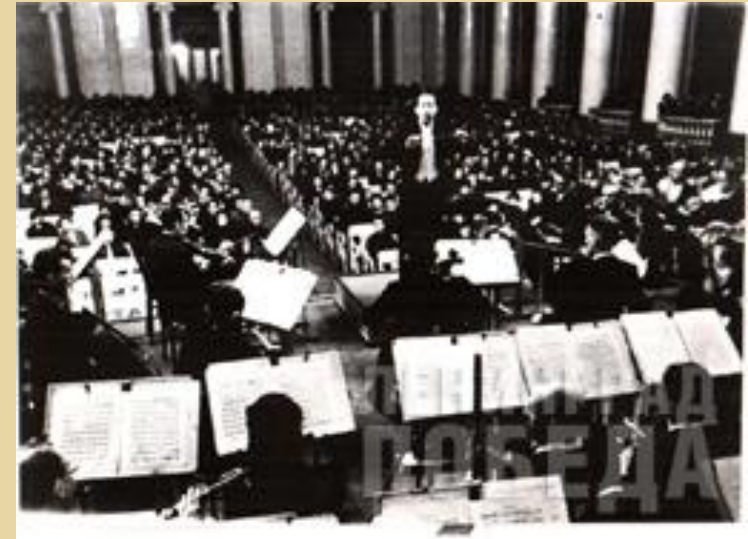
Возобновление концертов в Филармонии. 1 мая 1942 г.

2 июля «Ленинградская правда» сообщила о доставленной с Урала в Ленинград самолетом партитуре Седьмой (Ленинградской) симфонии Дмитрия Шостаковича и о предстоящем ее исполнении. Оно состоялось 9 августа в Филармонии и транслировалось по радио, ее слушали жители города и бойцы на фронте... Этот концерт в блокадном городе получил всемирный резонанс.