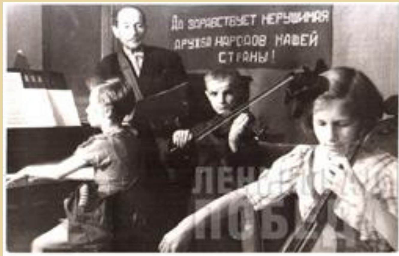
В детской музыкальной школе Петроградского района. Июнь 1942 г.

9 октября в Ленгорисполком поступило ходатайство о разрешении проводить занятия в музыкальном училище на ул. Некрасова (там объединились остатки трех музыкальных учебных заведений). Просьбу удовлетворили. А 15 октября было объявлено о возобновлении занятий в Консерватории.