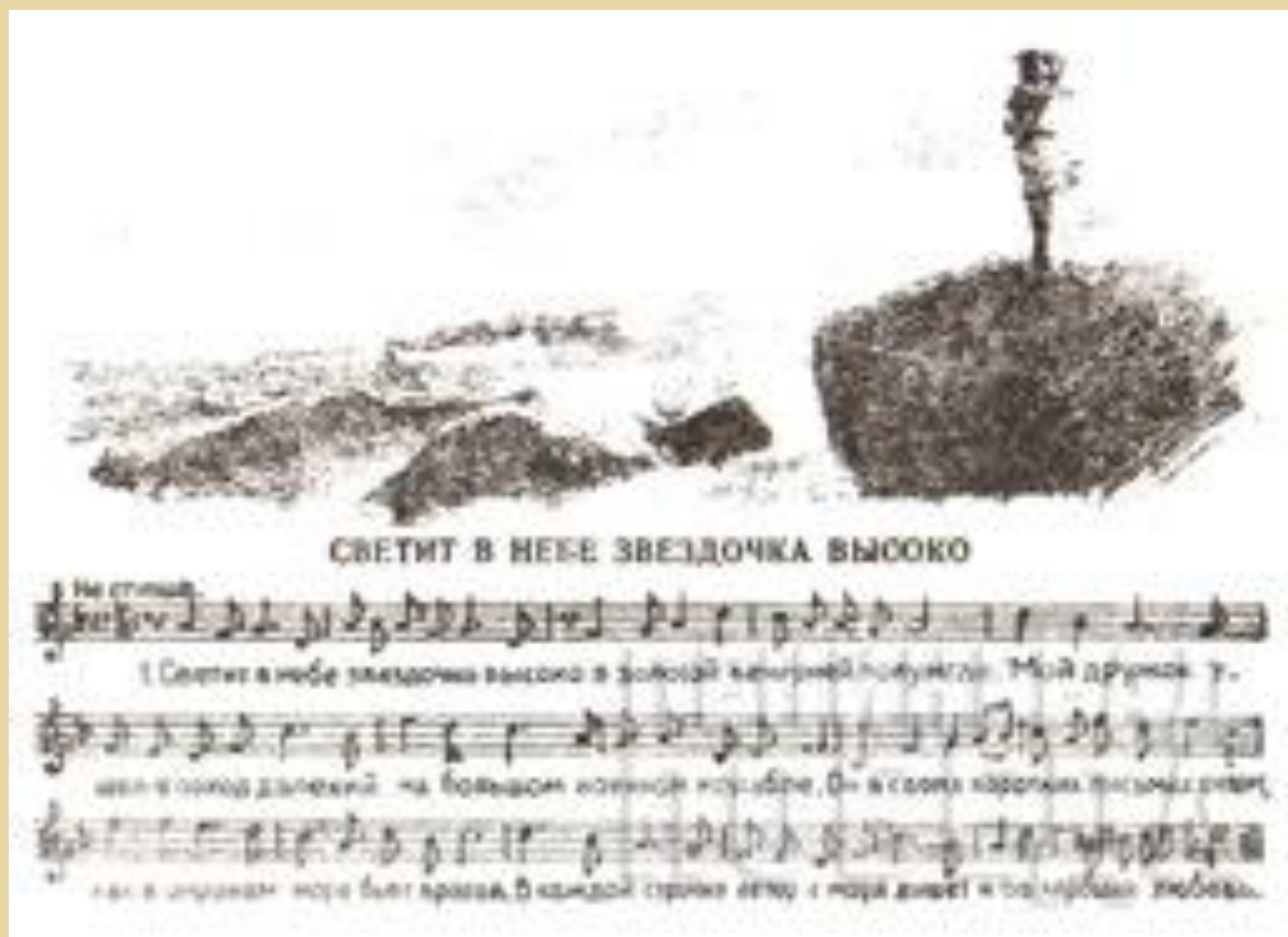
Песни печатались даже на почтовых открытках и конвертах.

Оставив позади ноябрь, город вступил в самый драматичный период осадной жизни. Декабрь–январь–февраль сосредоточили в себе все то, что мы и сегодня видим за словами «ленинградская блокада» – борьбу жителей и защитников города с голодом, холодом, цепкими объятиями смерти. Линия музыкальной жизни после непродолжительного подъема теперь резко пошла на спад и приблизилась к нулевой отметке. После нескольких спектаклей прервалась деятельность оперно-балетного коллектива. В конце декабря закрылись двери Филармонии, умолк голос симфонического оркестра: все меньше сил оставалось и у исполнителей, и у слушателей, иссякала электроэнергия, не работало отопление. На 11 января 1942 года в Капелле был назначен концерт «Полгода Великой Отечественной войны». Афиша обещала участие большой группы деятелей культуры и искусства. Однако выступили лишь немногие, а в зале, в основном, находились моряки, прибывшие в организованном порядке. Это был последний афишный концерт. За ним последовал длительный перерыв.