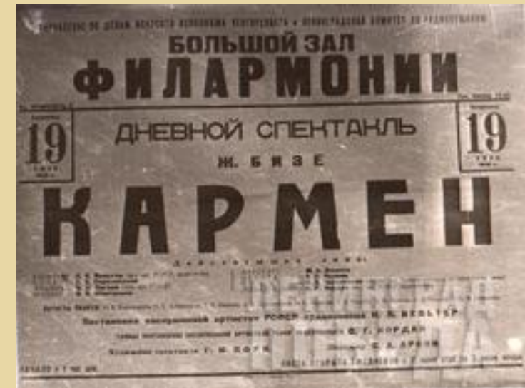
Афиша к спектаклю «Кармен». 19 июля 1942 г.