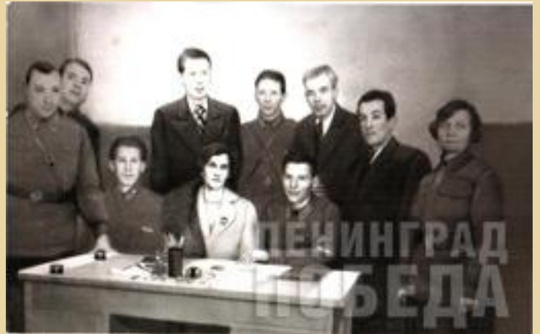
Мастера искусств в Кронштадте. Январь 1942 г.

В те же дни бригада мастеров искусств была направлена в Кронштадт: там артисты могли не только выступить, но и, как тогда говорили, «подкормиться» – продовольственное положение моряков было не столь катастрофично, как у ленинградцев. Подобные командировки артистов в более благополучные места (иногда даже за кольцо блокады) были достаточно распространенными.