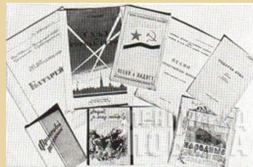
Песни, изданные в Ленинграде.