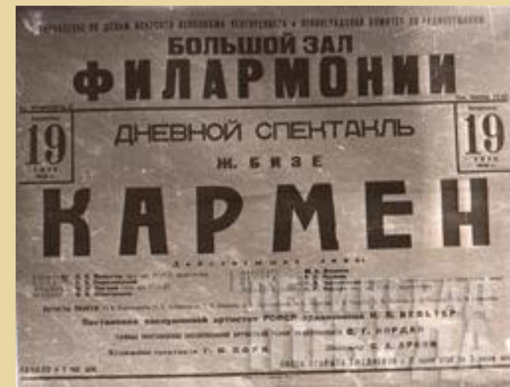
Афиша к спектаклю «Кармен». 19 июля 1942 г.