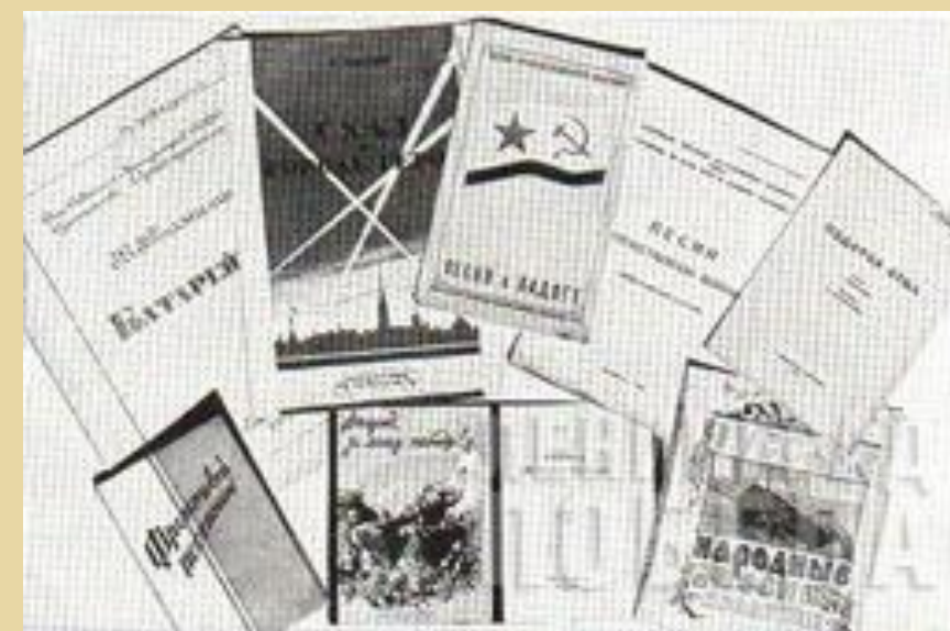
Песни, изданные в Ленинграде.