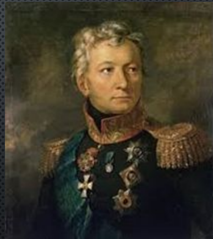
Александр Петрович Тормасов