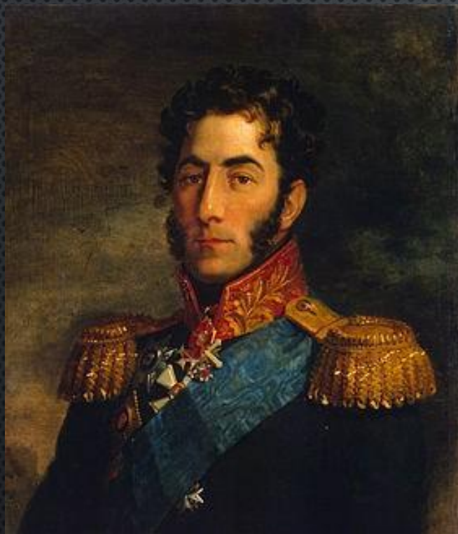
Петр Иванович Багратион