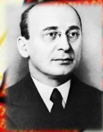
Л.П.Берия (1938 - 1953)