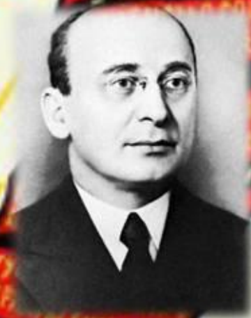
Л.П.Берия (1938 - 1953)