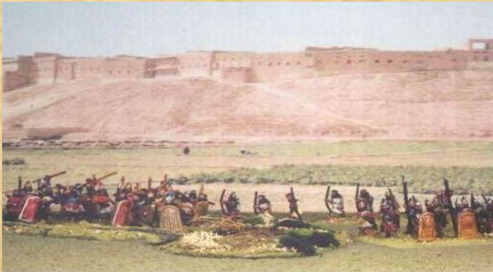
Персы у стен Вавилона. Реконструкция