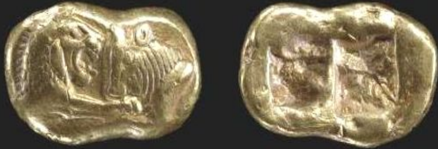
Лидийские монеты с клеймом, удостоверяющем вес. 6 в. до н. э.