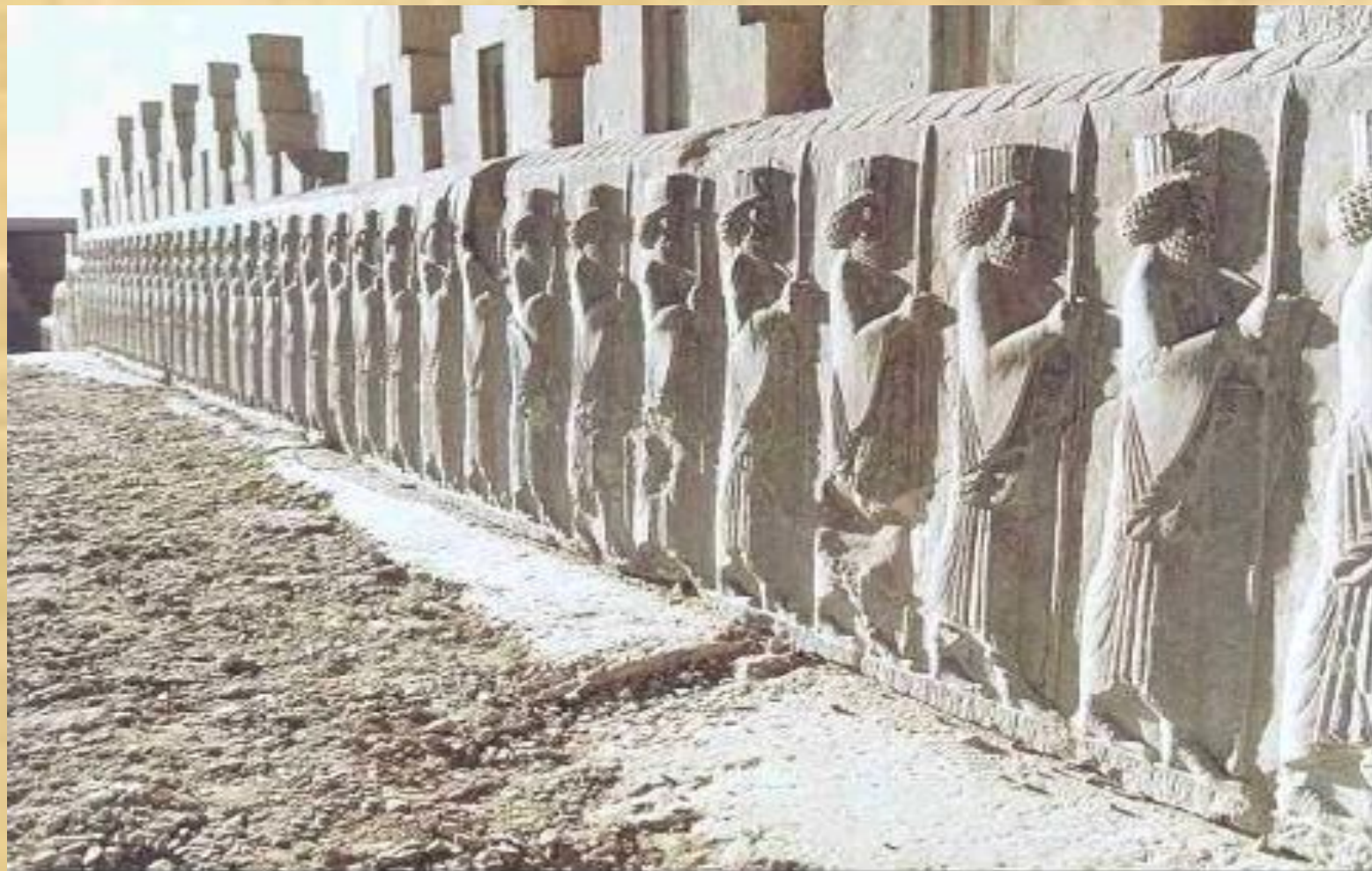
Персидские воины. Рельеф дворца Трипилон в Персеполе