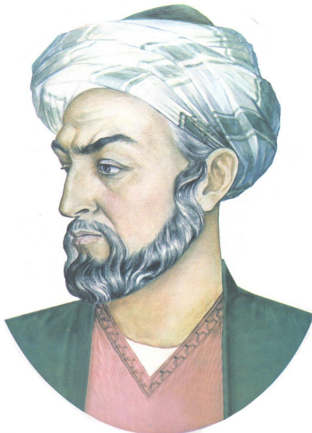
Абӯали Сино - Avicenna