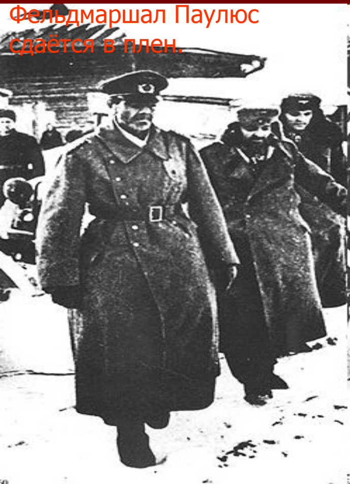
Фельдмаршал Паулюс сдаётся в плен.