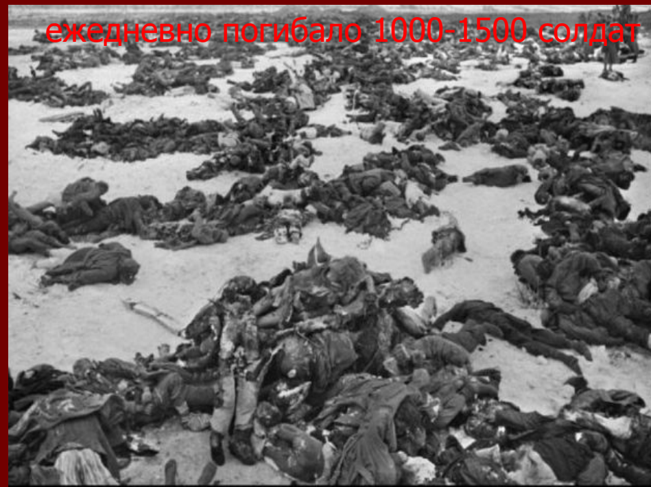
ежедневно погибало 1000-1500 солдат