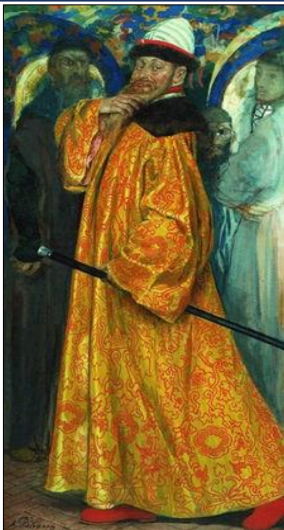
Илья Данилович Милославский