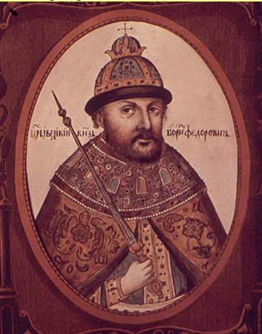
Царь Борис Федорович. Портрет из Титулярника.

Царствование Бориса Годунова было успешным до 1601 г.