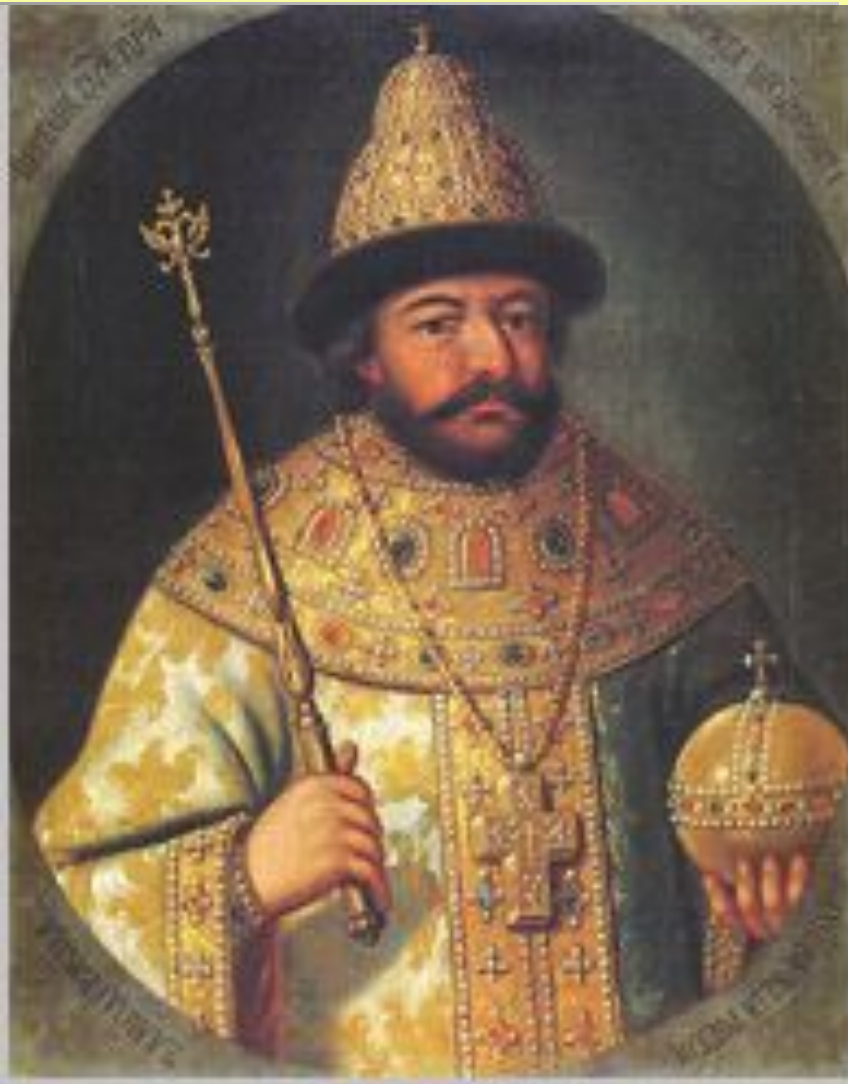
Царь Борис Годунов

Царь в 1598–1605 гг. Сын боярина. Служил в опричнине. Возвысился благодаря женитьбе на дочери Малюты Скуратова и браку своей сестры Ирины с царевичем Федором Ивановичем. Боярин с 1580 г. С воцарением Федора – член регентского совета, затем – единоличный правитель государства. Инициатор введения патриаршества. Сторонник сближения России с Западной Европой. Заключил Тявзинский мир со Швецией (1595). Вернул урочные лета (1597). Ввел белые слободы в тягло. При нем происходило интенсивное крепостное и церковное строительство. В 1598 г. после смерти Федора избран Земским собором на царство. Скоропостижно умер во время вторжения Пseudo-Иоанна Годунова.