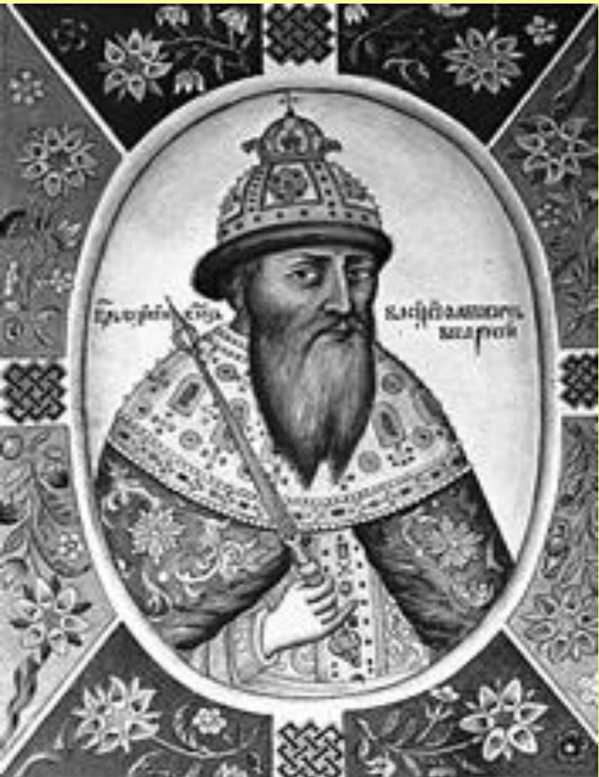
Царь Василий Иванович Шуйский

Во главе заговора, свергнувшего Лжедмитрия, стоял