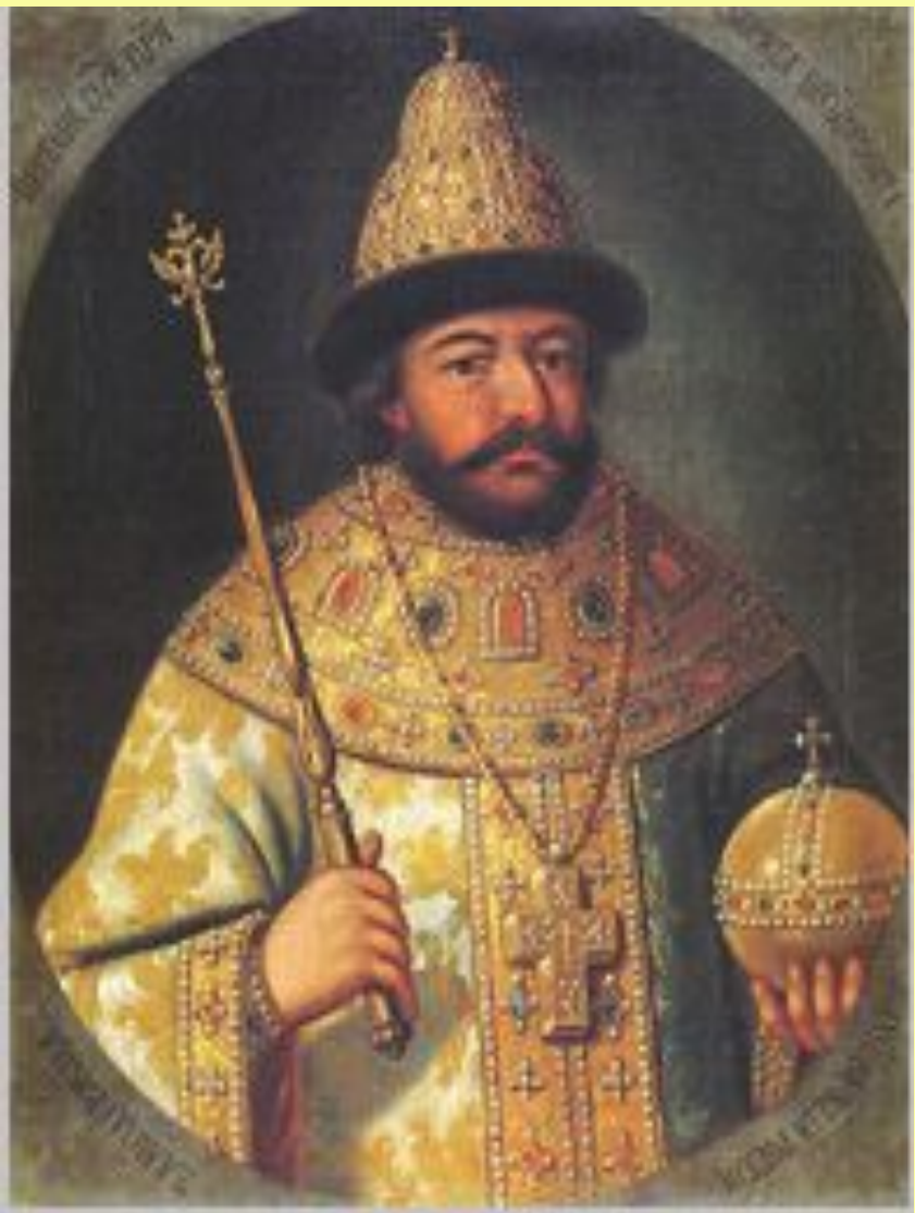
Царь Василий Иванович Шуйский

Русский царь в 1606–1610 гг. Вступая на престол, он впервые дал «крестоцеловальную запись», обещав не накладывать опалы без боярского суда, не слушать ложных доносов, не преследовать родственников опальных. «Крестоцеловальная запись» отражала ослабление царской власти в связи с прекращением законной династии. Дал некоторое подобие гражданских прав населению. Впервые осуществлялся принцип договора между царем и подданными