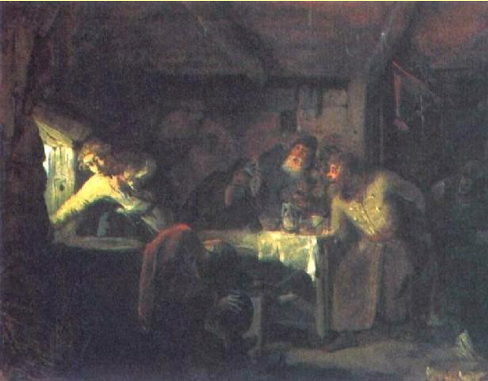
Бегство Гришки Отрепьева из корчмы на литовской границе. Худ. Г. Мясоедов

В 1604 г. в Литве объявился самозванец, называвший себя Дмитрием – беглый монах Чудова монастыря Григорий Отрепьев.