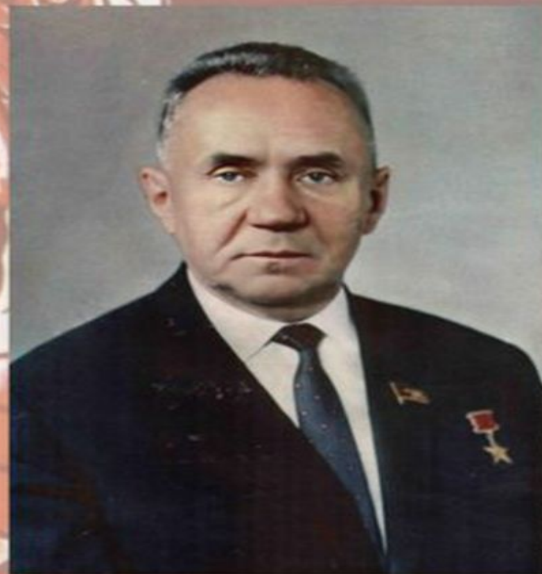
Косыгин Алексей Николаевич – председатель Совета Министров (1964 – 1980гг.)