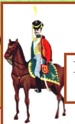
I. Барклай де Толли 110 000