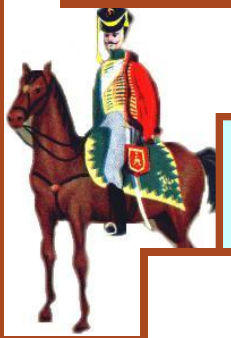
II. Багратион 49 000