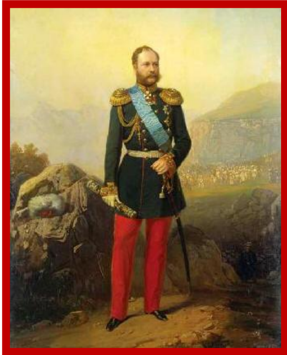
А. И. Барятинский