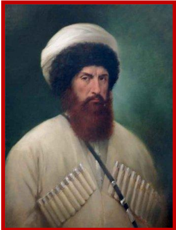
Имам Шамиль (1797) Имам