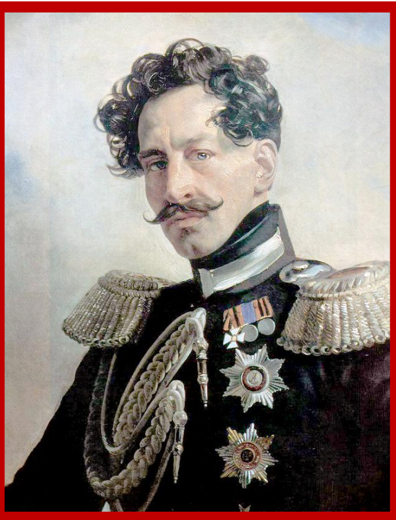
Оренбургский генерал- губернатор В.А. ПЕРОВСКИЙ.