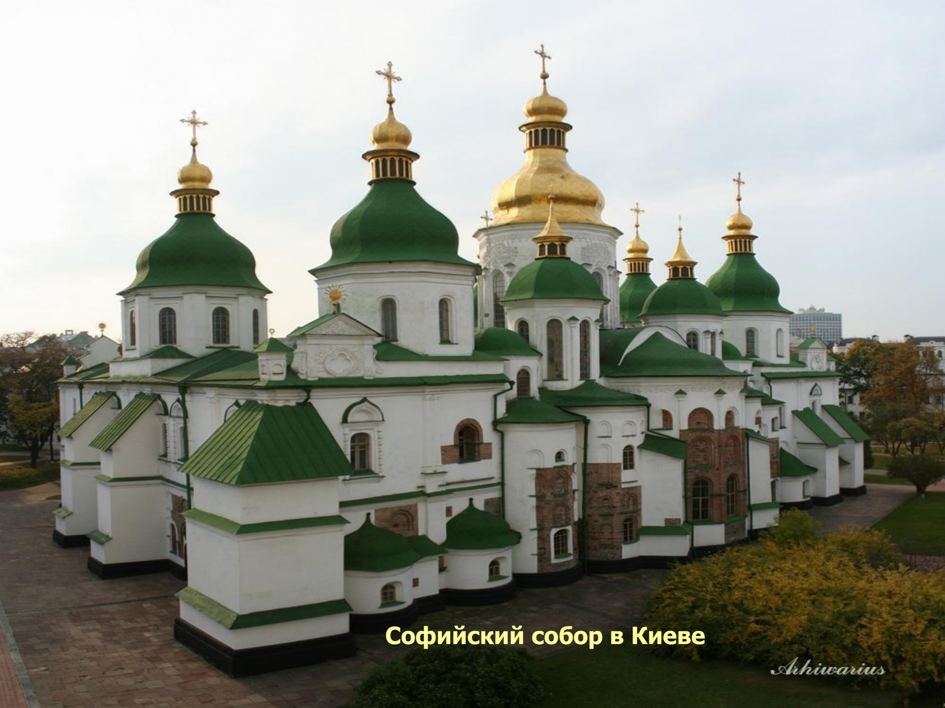
Софийский собор в Киеве