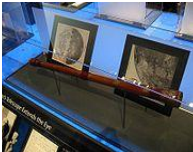
Телескоп Галилея (современная точная копия)