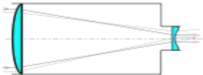
Устройство телескопа системы Галилея

В 1609 году Галилей самостоятельно построил свой первый телескоп с выпуклым объективом и вогнутым окуляром . Труба давала приблизительно трёхкратное увеличение. Вскоре ему удалось построить телескоп, дающий увеличение в 32 раза. Отметим, что термин телескоп ввёл в науку именно Галилей (сам термин предложил ему Федерико Чези, основатель «Академии деи Линчеи» ).