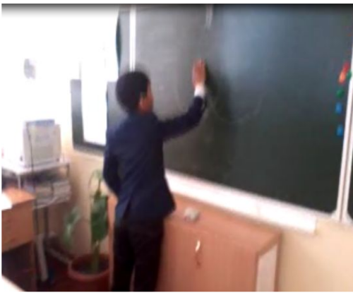
Венн диаграммасы орындау барысы