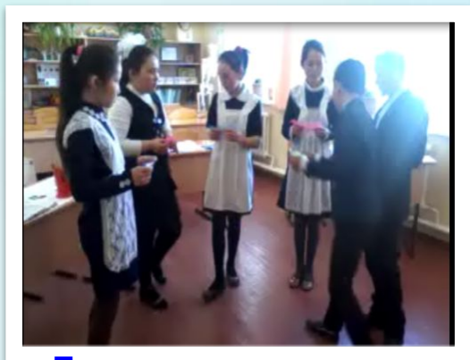
Бантик таңдау арқылы топқа бөлу