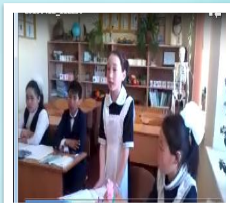
«Блум таксономиясының өлшемдерінің сұрақтары» арқылы үй тапсырмасын тексеру.