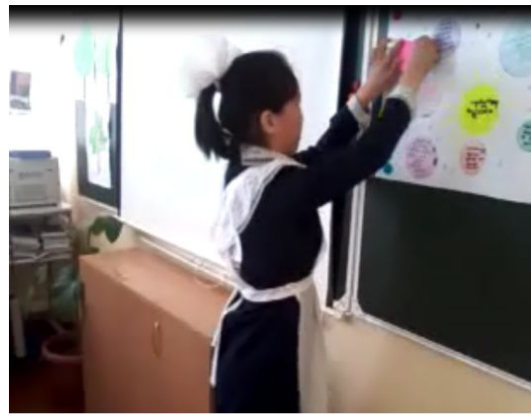
“Сэндвичі” әдісі арқылы постерді өзара топтық бағалау. бағалау .бағалау. avi