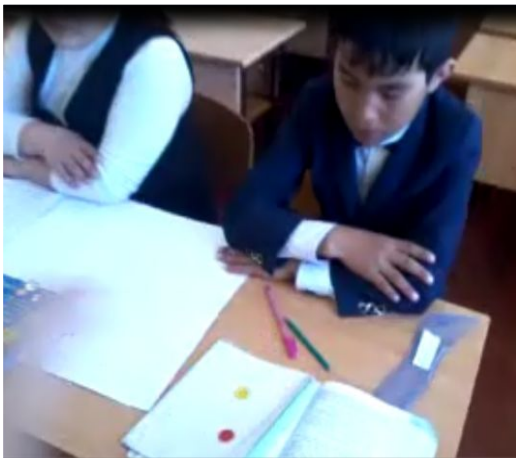
Смайлик арқылы бағалау