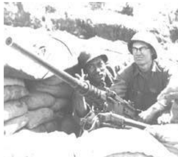
Солдаты армии США в Корее