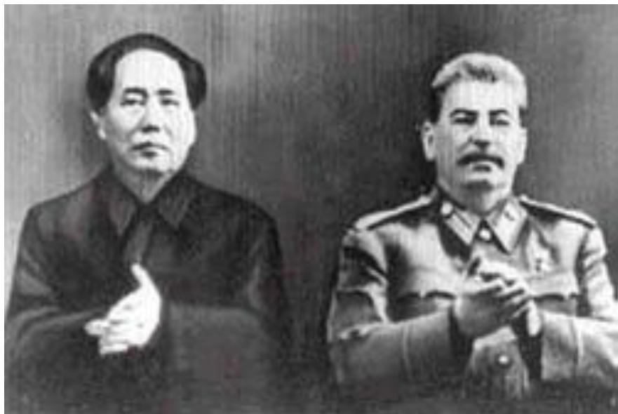
Мао Цзедун и Иосиф Сталин