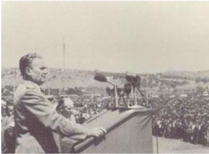
Иосип Броз Тито