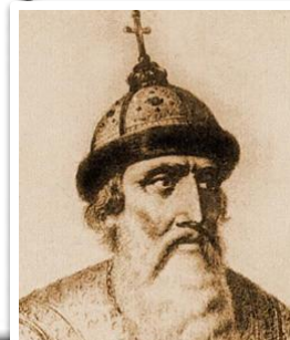
Владимир Всеволодович (Мономах) 1113 – 1125 гг.