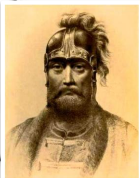
Святополк Изяславович 1093 – 1113 гг.