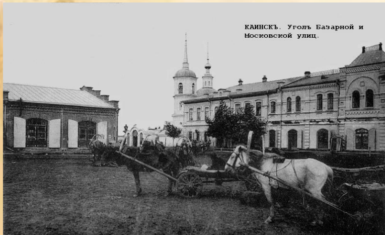
КАИНСКЪ. Уголь Базарной и Московской улиц.