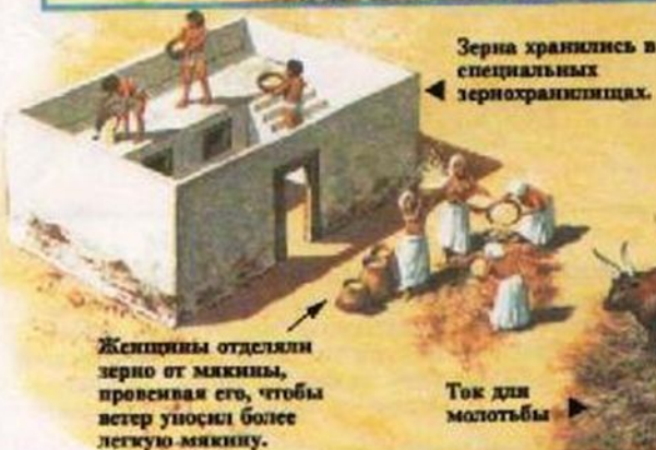
Зерна хранились в специальных зернохранилищах.

Питьевую воду хранили в тени под деревом или под навесом.