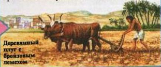
Деревянный плуг с бронзовым лемехом

После того как паводок отступал, крестьяне вспахивали поля. Они сеяли семена, разбрасывая их пригоршнями и гоняли по полям скот, чтобы животные втоптали их в землю. В течение следующих недель земледельцы пропалывали сорняки и поливали всходы.