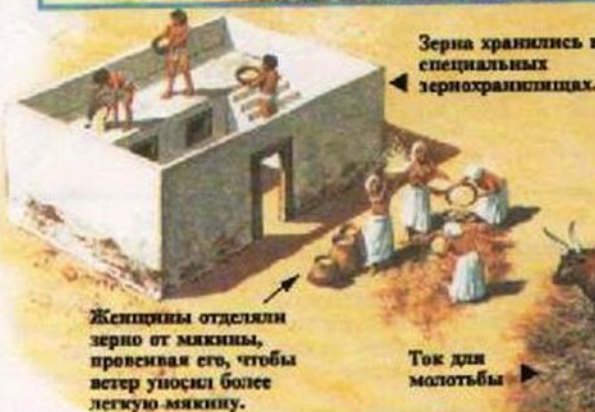
Зерна хранились в специальных зернохранилищах.

Питьевую воду хранили в тени под деревом или под навесом.