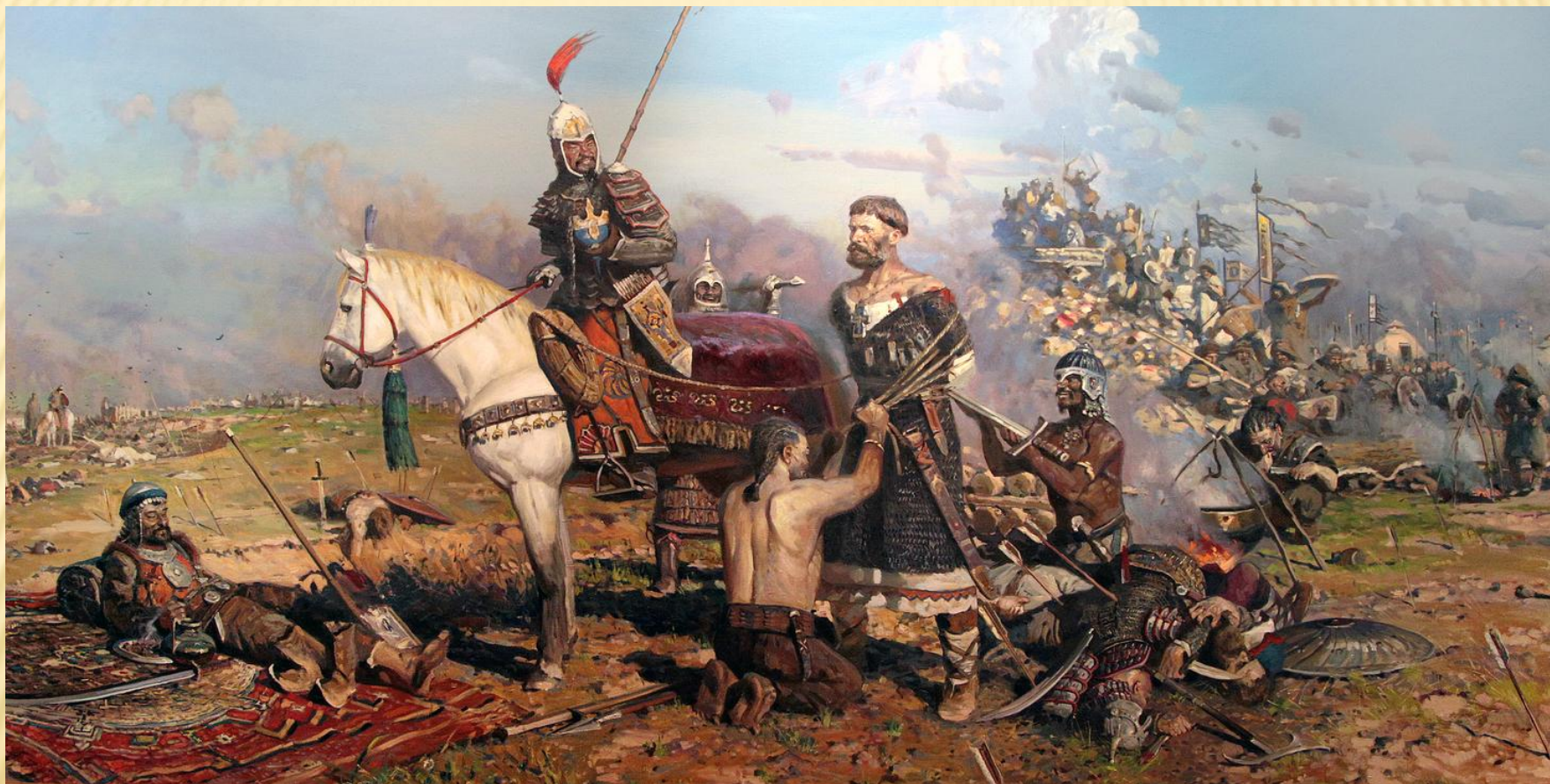
Битва на Калке