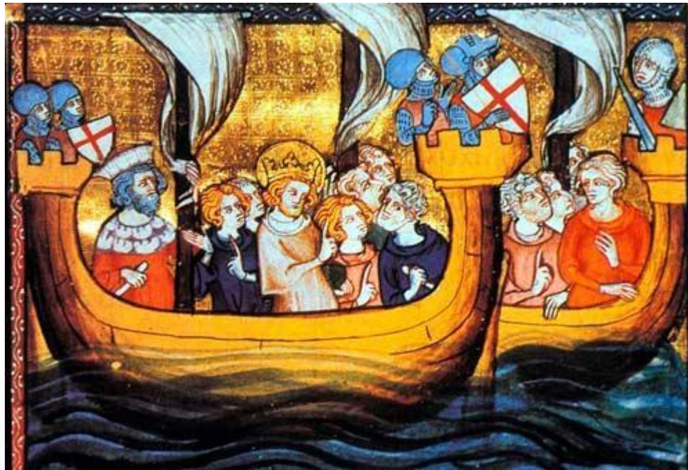
Крестовый поход Людовика Святого

Летом 1249 года король Людовик IX высадился в Египте. Христиане заняли Дамиетту, а в декабре достигли Мансуры. В феврале следующего года Роберт, опрометчиво ворвавшись в этот город, погиб; несколько дней спустя мусульмане едва не взяли христианский лагерь. Когда в Мансуру прибыл новый султан (Эйюб умер в конце 1249 года), египтяне отрезали крестоносцам отступление; в христианском лагере открылся голод и моровая язва