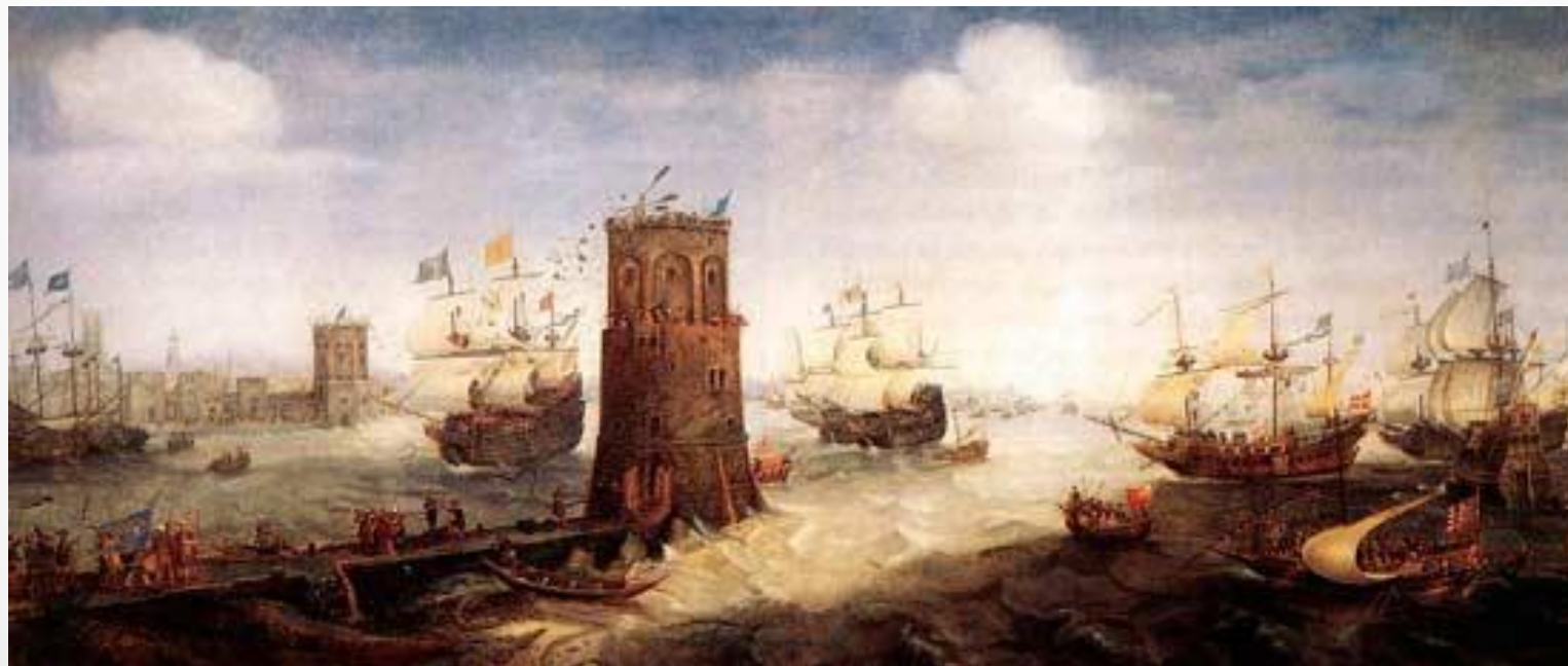
Штурм крестоносцами Пятого похода башни Дамиетты.

Можно назвать поход короля Андрея II Венгерского и герцога Леопольда VI Австрийского в Сирию (1217–1221). Вначале он шёл вяло, но после прибытия с Запада новых подкреплений крестоносцы двинулись в Египет и взяли ключ для доступа в эту страну с моря – город Дамиетту. Но попытка захватить крупный египетский центр Мансуру успеха не дала. Рыцари ушли из Египта, и Пятый Крестовый Поход окончился восстановлением прежних границ.