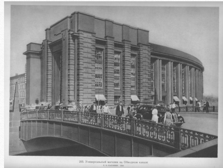
205. Универсальный магазин на Обводном канале К. И. Вайсман, 1934