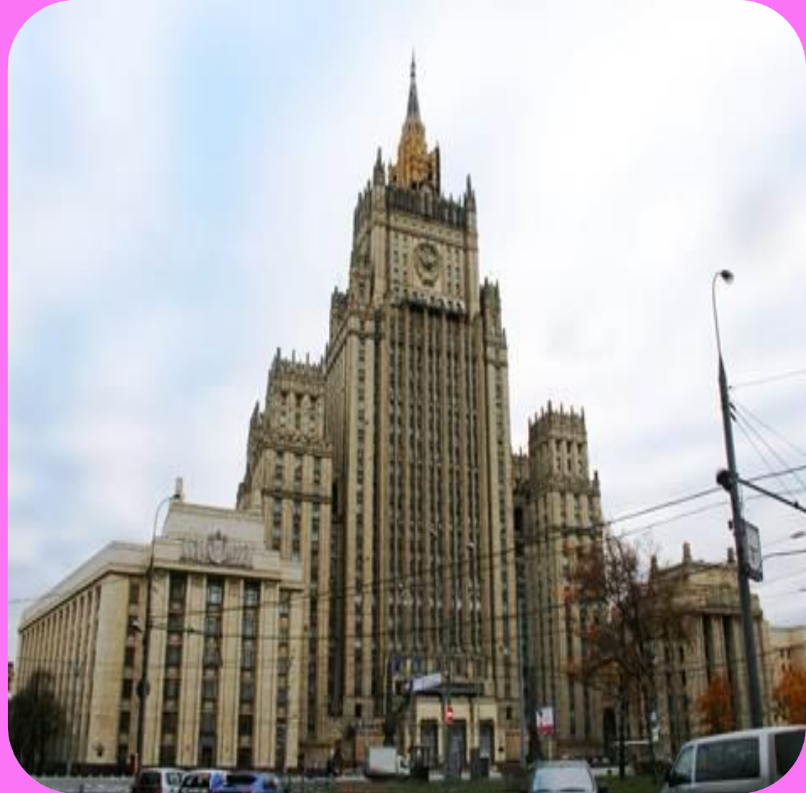
Сталинский ампир. Министерство иностран ных дел