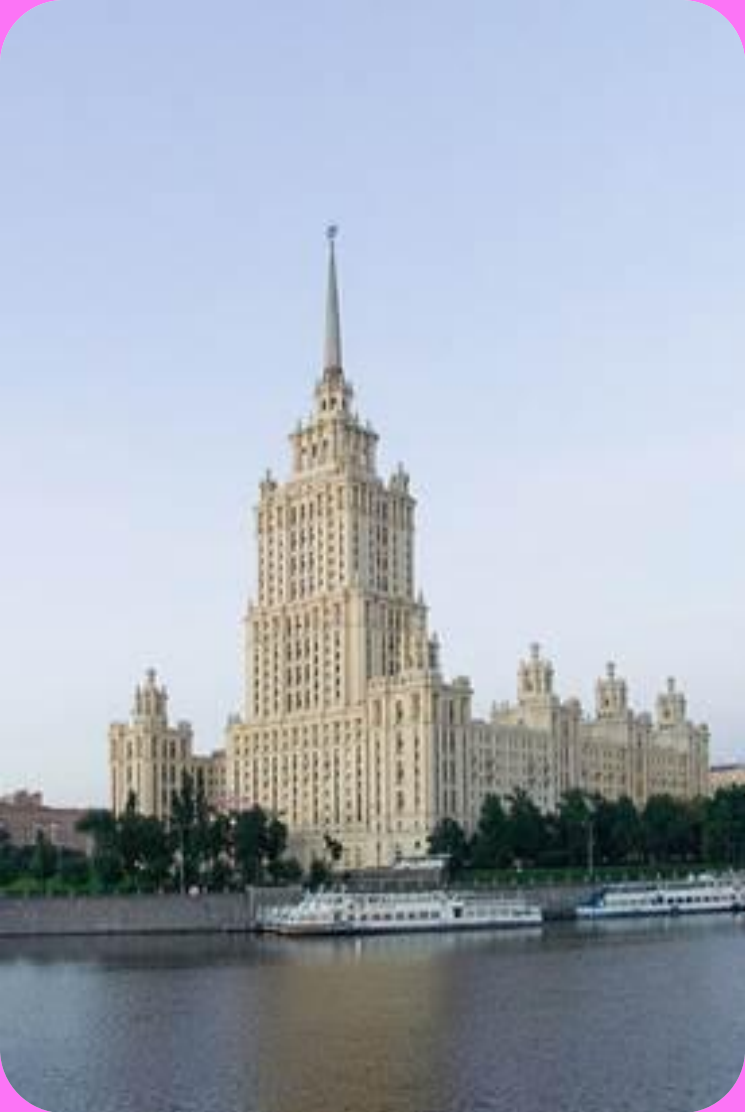
Сталинский ампир. Гостиница «Украина»