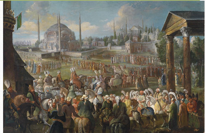
Шествие Султана в Стамбуле. Худ. Ж.Б. ван Мур