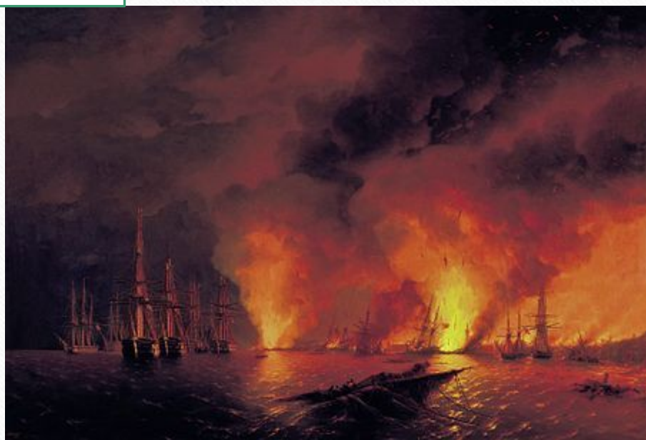
Айвазовский И.К. «Ночь после Синопского сражения 18 ноября 1853 г.»