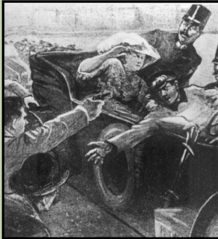
Убийство в Сараево 28 июня 1914 г.

Однако несколько лет он жил в Сербии – этот факт дал правительству Габсбургов предположить, что Сербия замешана в акте террора.