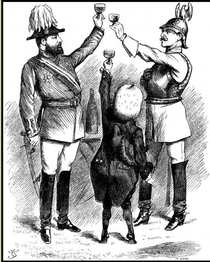
Карикатура начала XX в.