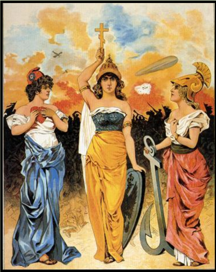
Российский плакат 1914 года.