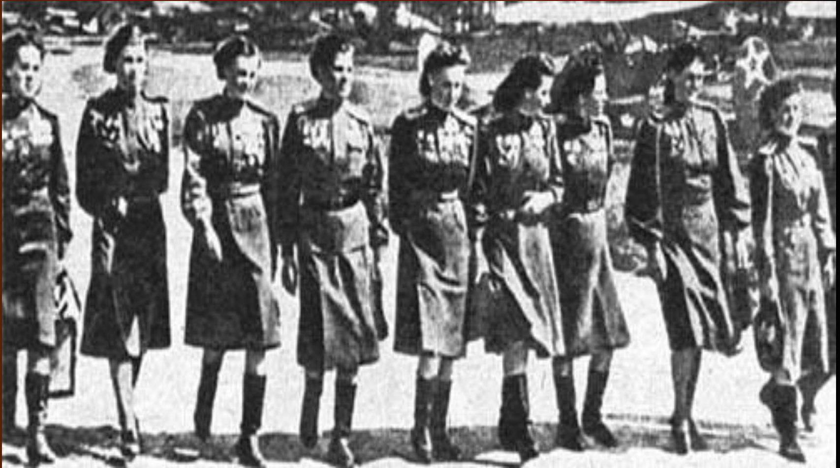
Белоруссия 1944 год.