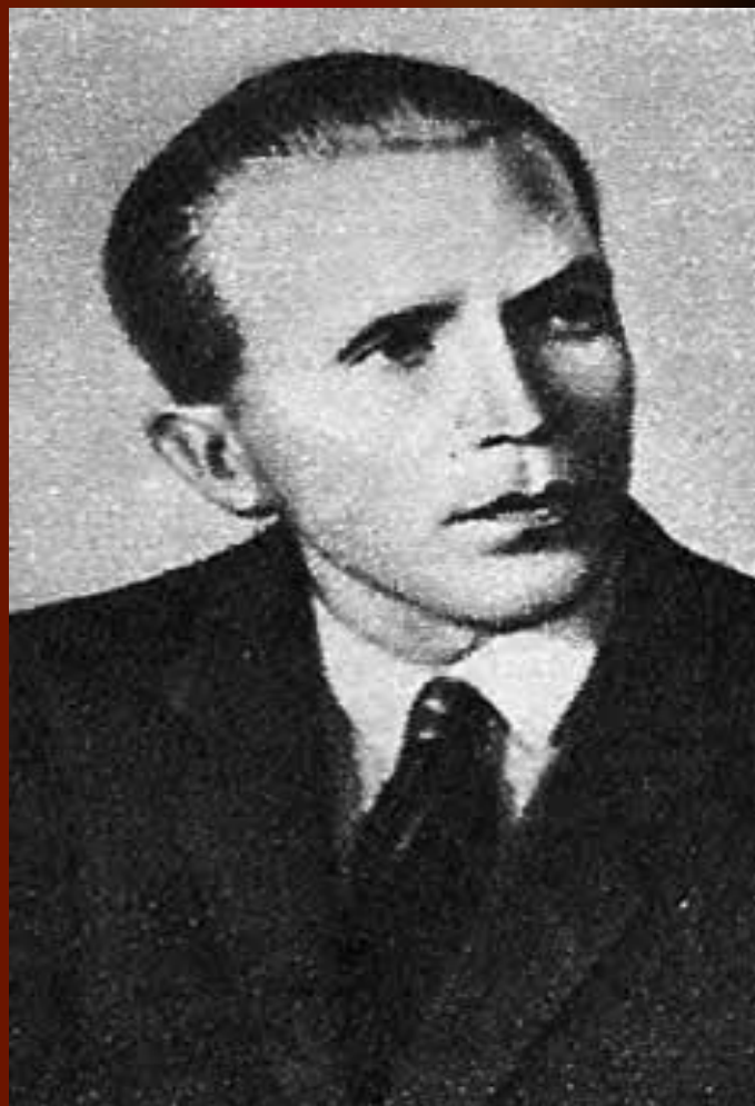
Герой Советского Союза разведчик Н. И. Кузнецов.