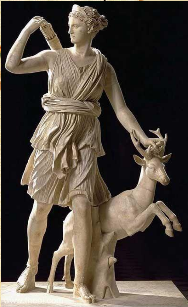
Артемида Богиня охоты