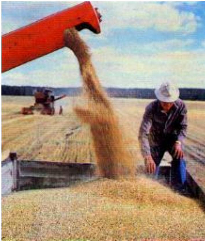
Уборка хлеба в Башкирии

Экономическая реформа 1965 г. Делала акцент на усиление специализации республик. Каждая из них развивала традиционное производство. В интересах интеграции шло ускоренное развитие наименее развитых с т.з. промышленности союзных республик. В большей мере этот процесс затронул Белоруссию, Молдавию, Туркмению, Киргизию, Азербайджан, Узбекистан и Литву. Одновременно была преодолена их обособленность .