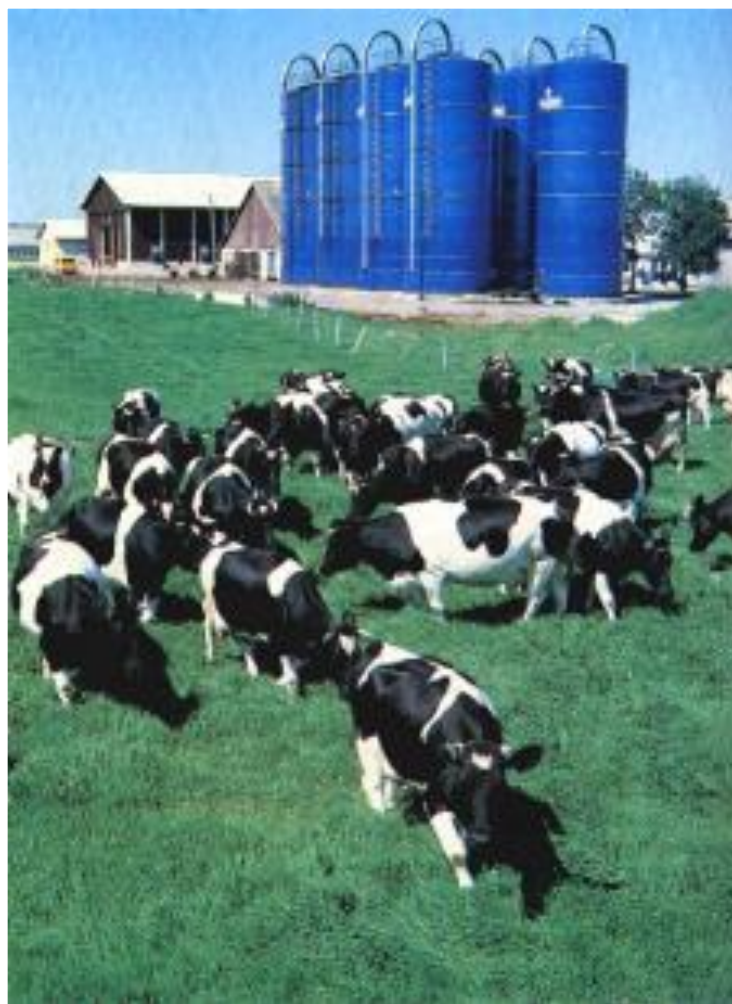
Животноводческий комплекс в Литве.

Бурное промышленное строительство в республиках привело к усилению роли Центра. В 70-е гг. были ликвидированы те права и привилегии, которые республики получили в 50-е гг. Экономическое, социальное и культурное развитие теперь шло под контролем Кремля. Переселение в республики русскоязычных кадров воспринималось там как русская экспансия. Это привело к усилению национализма.