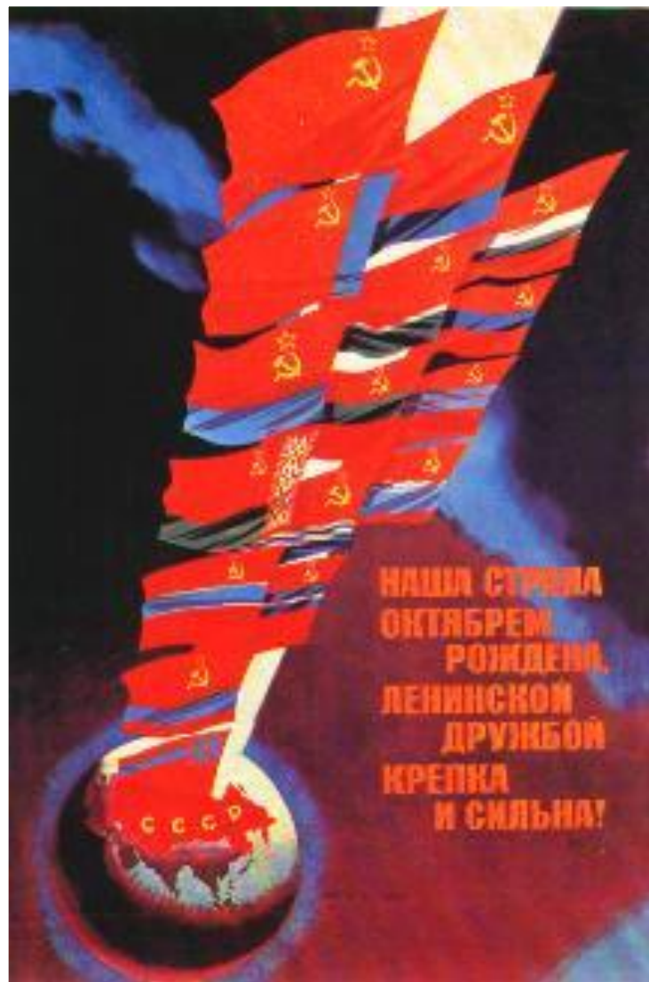
Плакат к 50-летию образования СССР.

В условиях роста национальных движений власти скорректировали национальную политику. Репрессии применялись лишь к участникам открытых выступлений. Национальные кадры стали массово награждаться орденами, медалями и почетными званиями. Началась «коренизация» местного руководства. Во главе республик встали представители коренной национальности, а русские, занимая посты 2-го секретаря оказывались в роли «наблюдателей»