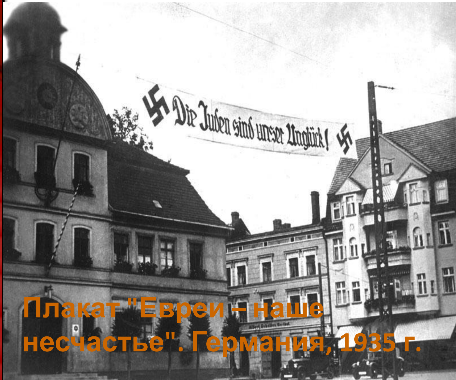
Плакат "Евреи – наше несчастье". Германия, 1935 г.