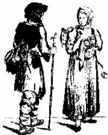
А. К. С. 1790. Кустовые в деревенской Одессе. XVIII в.

1) неорганизованность восставших; 2) вера в «доброе царя»; 3) форма протеста – побег с завода.