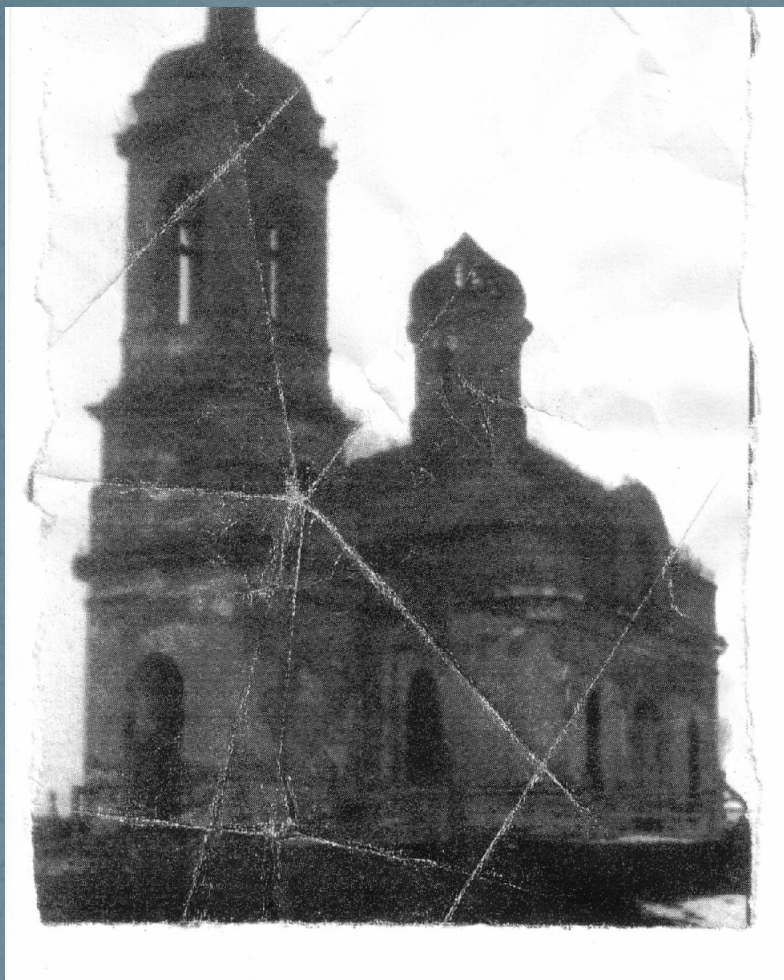
Храм Петра и Павла с.Верхняя Серебрянка