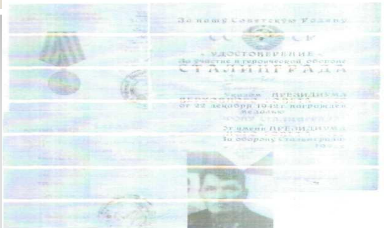
Күрше авыл батыры – Хамитов Галинурның военный билеты