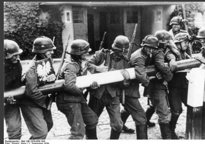
13. September 1939