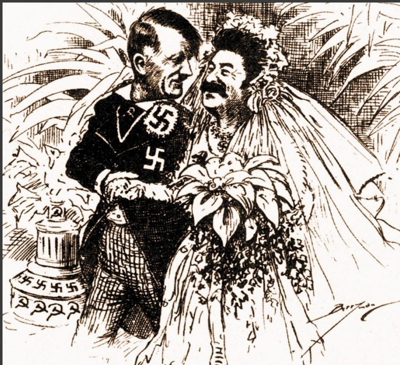
Английская карикатура на союз СССР с Германией.