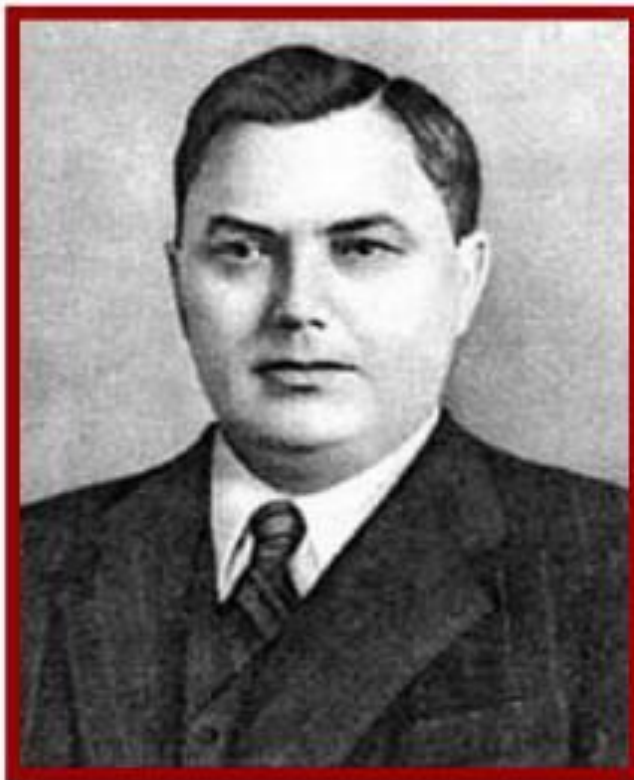
Г. Маленков – председатель Совета Министров