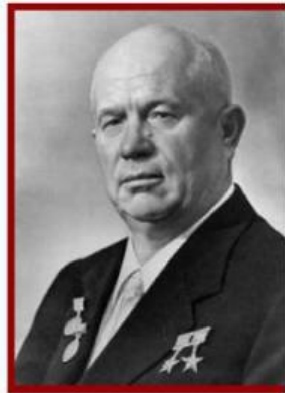
Н. С. Хрущев – первый секретарь ЦК КПСС