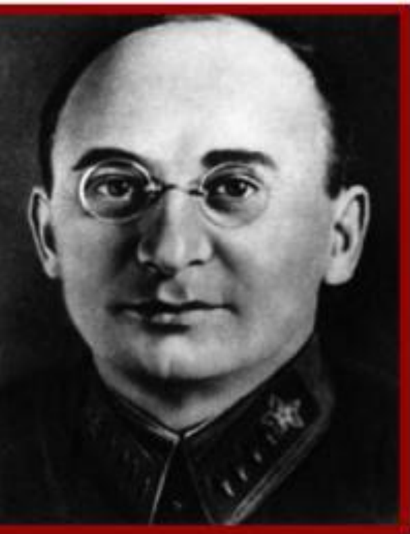
Л. Берия – министр внутренних дел и МГБ