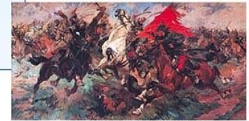
Н. С. Самокиш. Атака. Бой за знамя