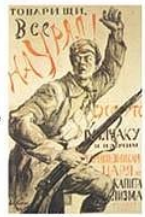
П. Киселис. Плакат «Товарищи, все на Урал!»