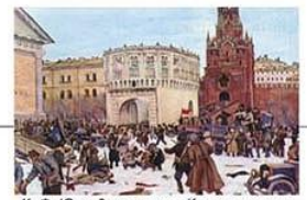
К. Ф. Юом. Вступление в Кремль отрядов Красной гвардии

Крестьянские восстания против советской власти Границы государств в 1914 г. Граница советских республик на март 1921 г.