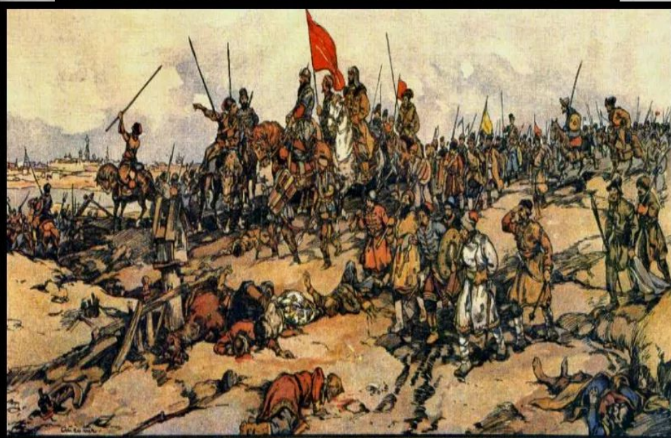
НАРОДНОЕ ДВИЖЕНИЕ В СМУТНОЕ ВРЕМЯ

Лжепетр со своим отрядом присоединился к И. Болотникову летом 1606 года, когда тот шел на Москву с целью свержения с престола царя Василия Шуйского .