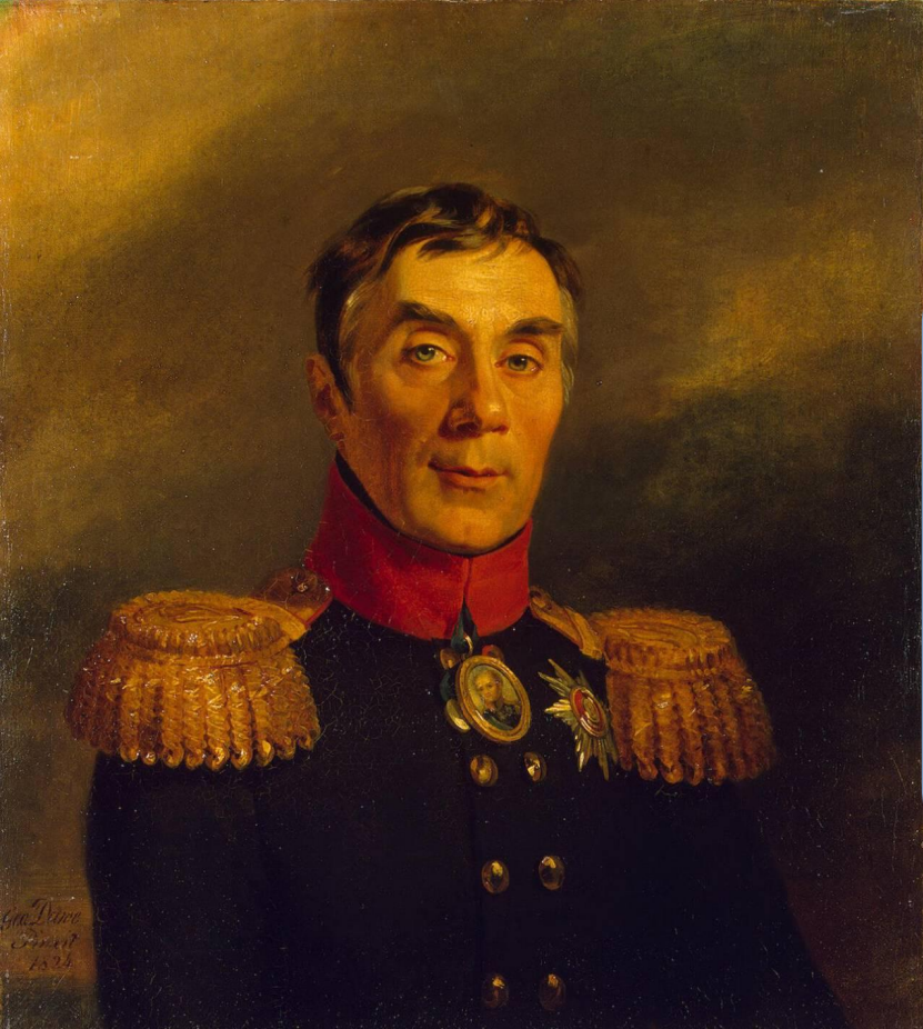
Алексей Андреевич Аракчеев.

Всей России притеснитель , Губернаторов мучитель И Совета он учитель, А царю он – друг и брат . Полон злобы , полон лести, Без ума , без чувств, без чести, Кто ж он ? Предан бел лести , .....грошовый солдат.