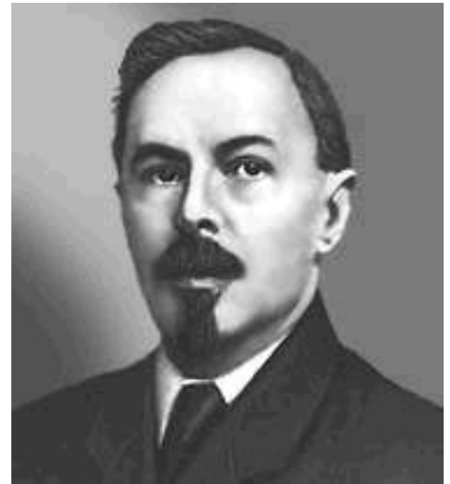
Г. Я. Сокольников

• В 1922 закончился голод. Год был урожайным, сказались и благоприятные погодные условия, и заинтересованность крестьян в труде. Доходы государства были достаточными для проведения финансовой реформы — замены обесценившихся советских денег на более устойчивую валюту с золотым обеспечением («твердый рубль» и «золотой червонец»). Реформа была проведена под руководством наркома финансов Г. Я. Сокольникова. В феврале 1924 был прекращен выпуск денег старого образца, а к маю проведен обмен старых денег на новые. В обращение вернулись металлические копейки. Введение твердой валюты обеспечило более четкие расчеты как внутри страны, так и за рубежом, обеспечило углубление рыночных отношений в 1924-1926 гг., после чего рубль опять стал обесцениваться.