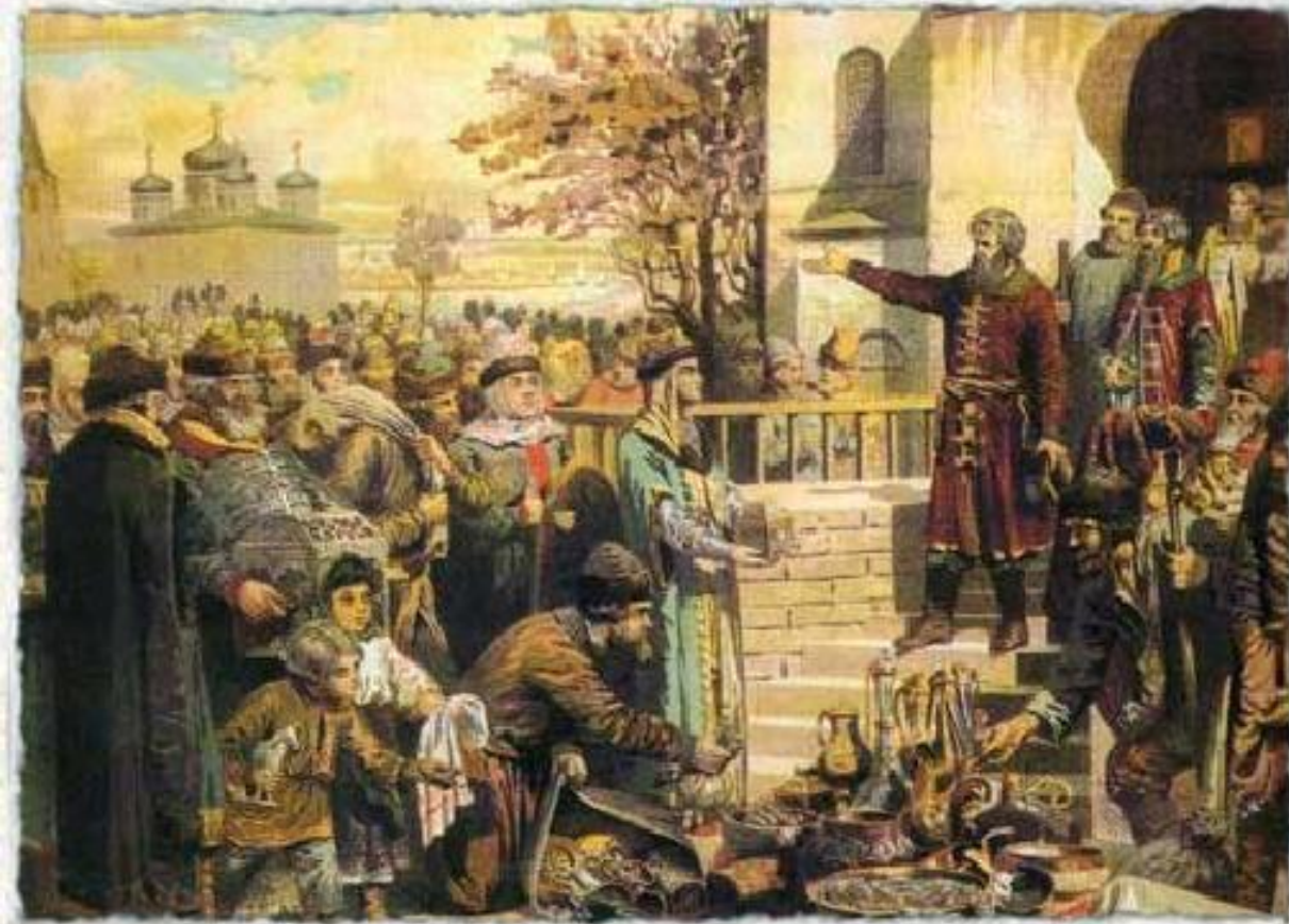
Нижегородцы откликаются на призыв Минина собрать средства для ополчения. Картина А.Д.Кившенко. XIX в.

Осенью 1611 г. по призыву нижегородского земского старосты Кузьмы Минина начался созыв Второго ополчения.