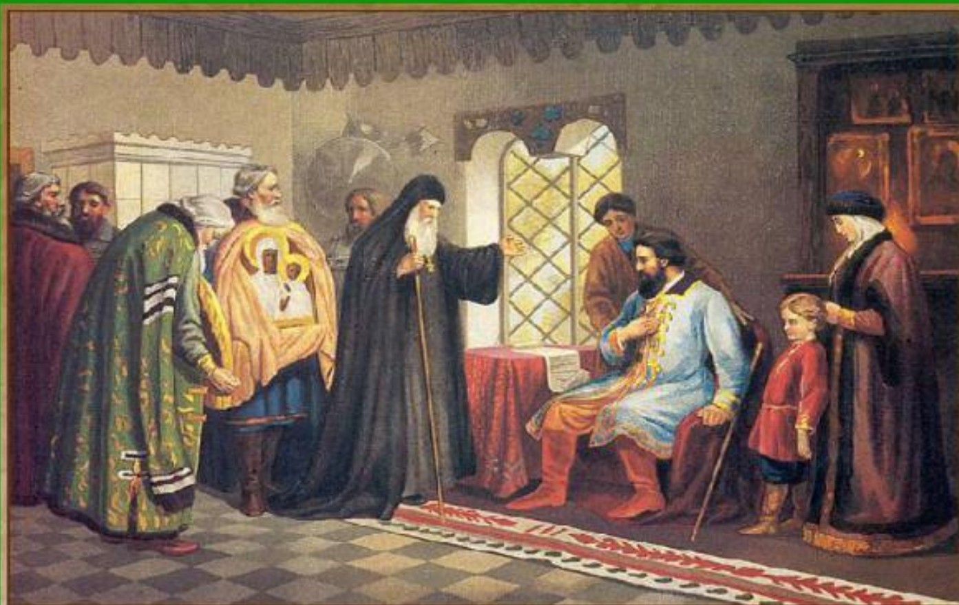
Нижегородские послы у князя Дмитрия Пожарского. 1611 г.

Военным руководителем ополчения стал князь Д. М. Пожарский.