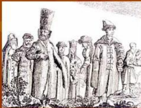
Рис. сверху: Королевич Владислав. (Гравюра XVII в.)

Рис. внизу: Московские бояре. (Гравюра XVI в.)