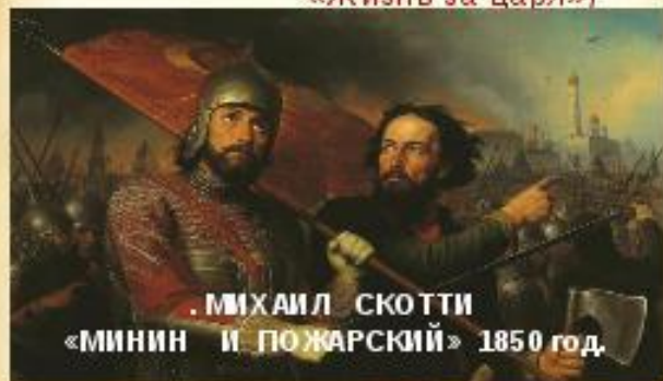
МИХАИЛ СКОТТИ «МИНИН И ПОЖАРСКИЙ» 1850 год.