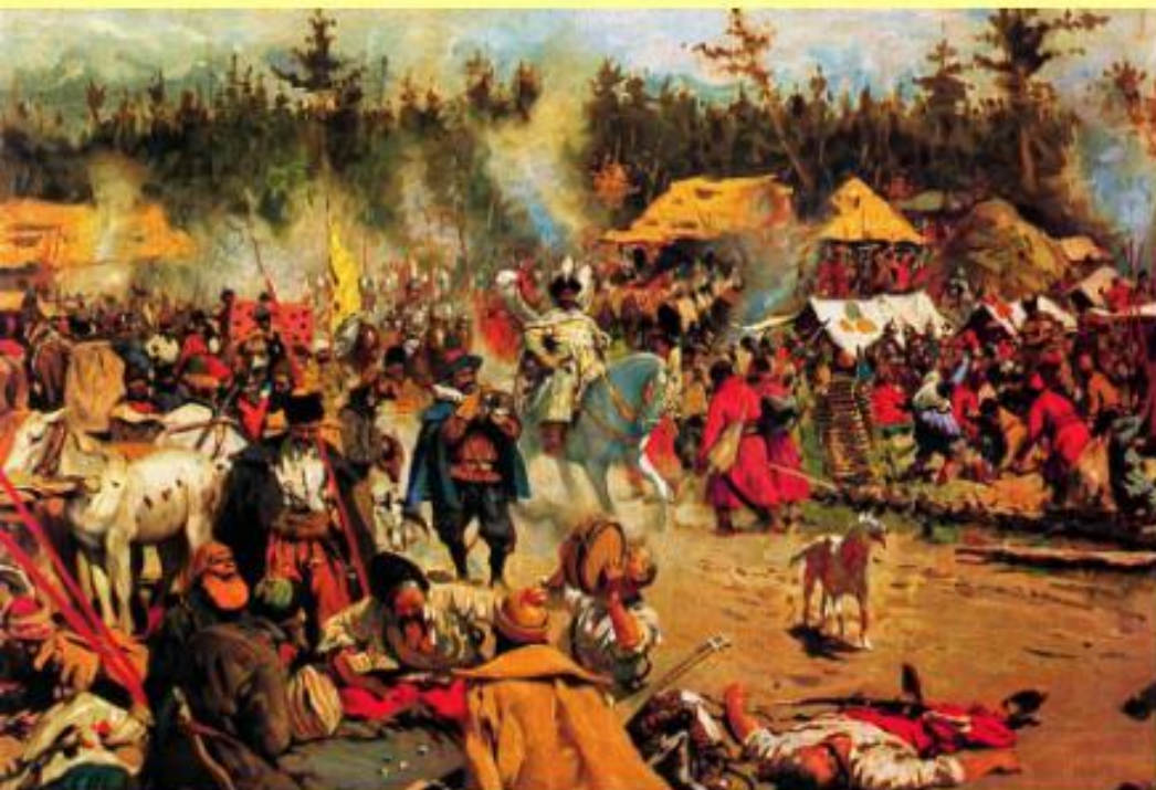
Смутное время. Худ. С. Иванов

Бесчинства и грабежи тушинцев оттолкнули от них поддерживавшее их поначалу население