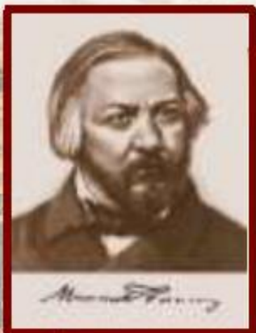
Михаил Глинка, автор оперы «Жизнь за царя»