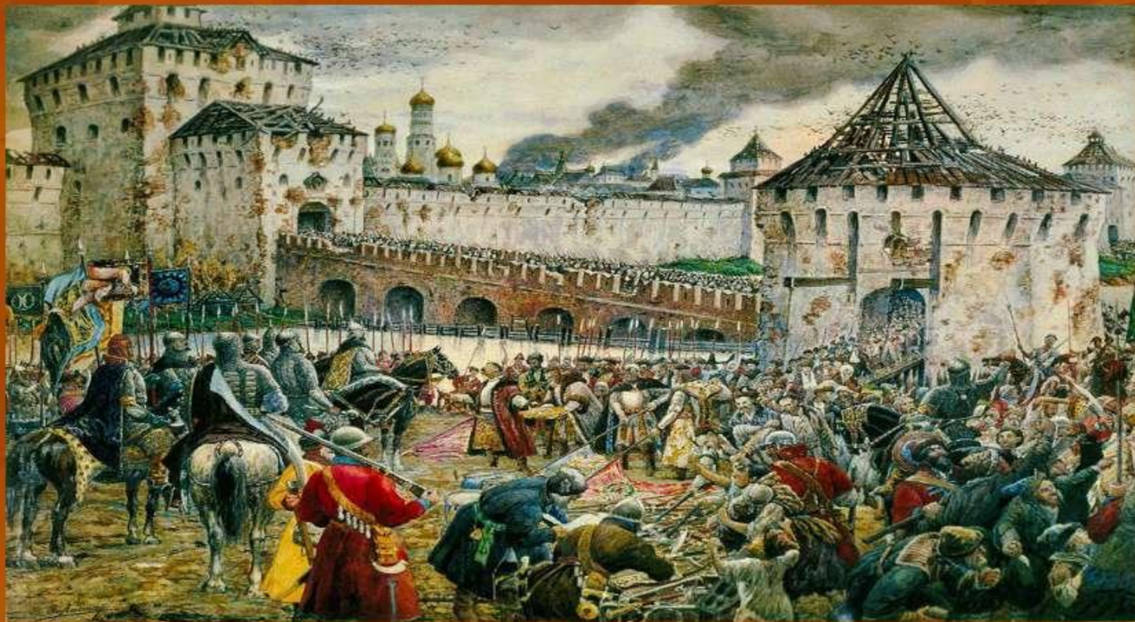
Э.Э.Лиснер. «Изгнание поляков из Кремля»

4 ноября 1612 года объединёнными усилиями народных ополчений в ходе ожесточённых боёв от польских захватчиков был освобождён Китай-город. После этого их кремлёвский гарнизон сдался, и Москва была окончательно освобождена от врагов.