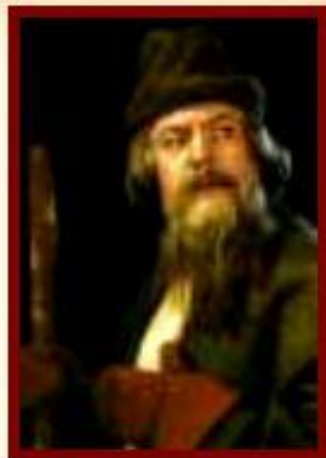
Иван Сусанин (роль в спектакле «Жизнь за царя»)