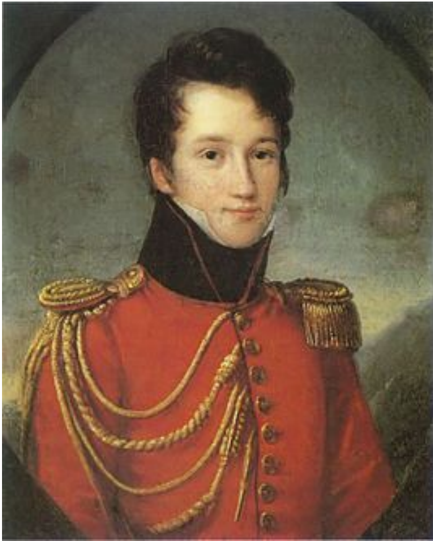
Альфред Виктор де Виньи 1797-1863, французский писатель