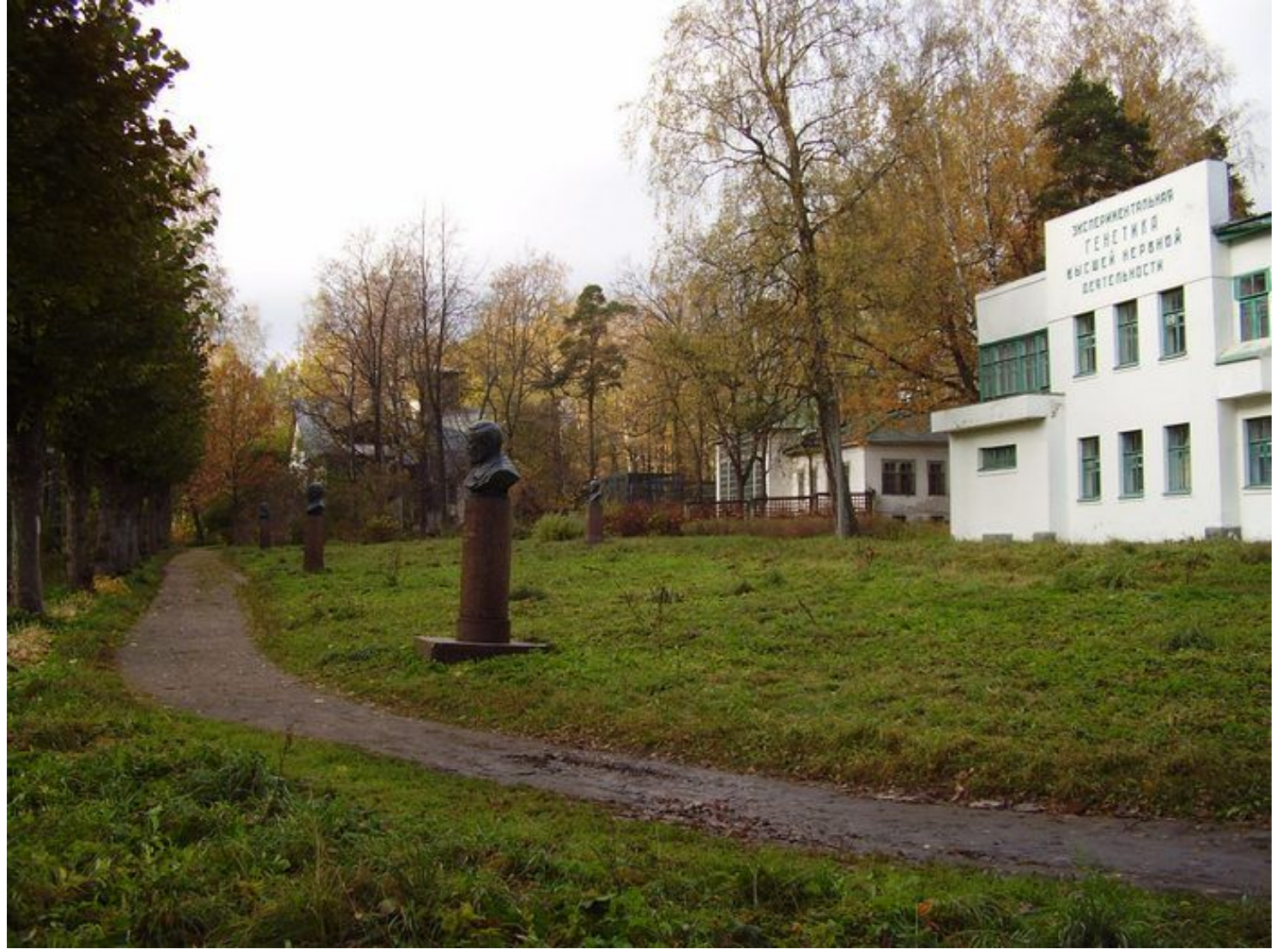
Иван Петрович Павлов