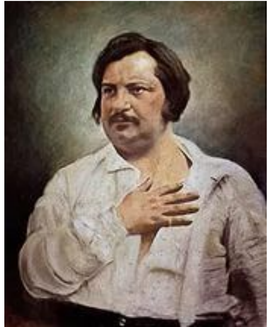
Онорé де Бальзак 1799 - 1850 французский писатель,