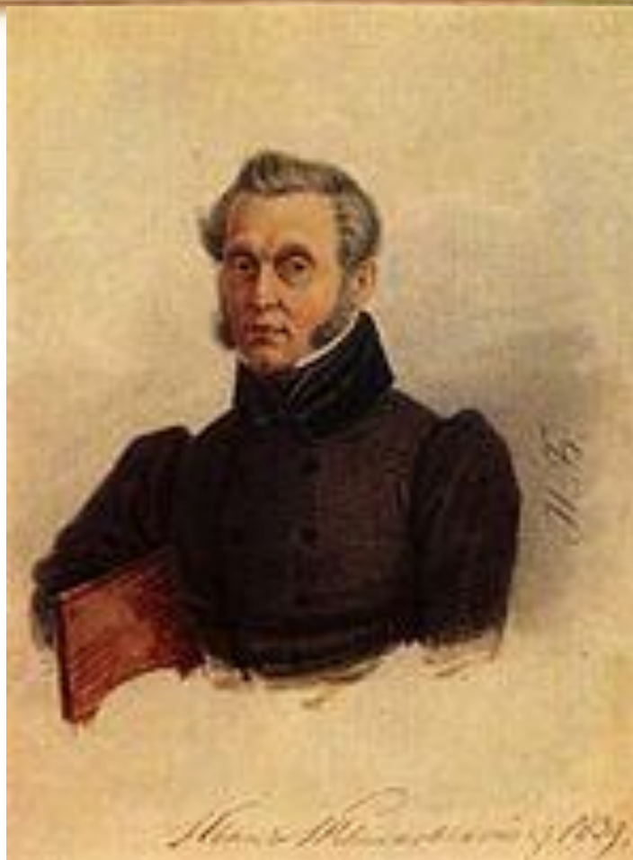
Полковник Иван Повало- Швейковский