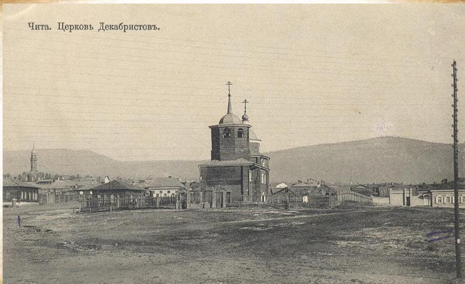
Чита. Церковь Декабристовъ.