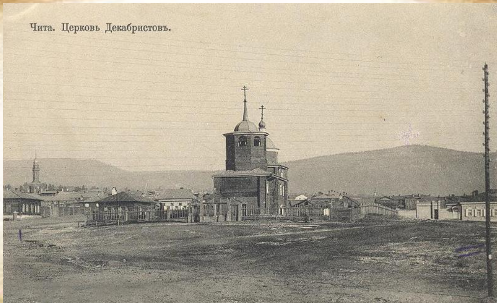
Чита. Церковь Декабристовъ.