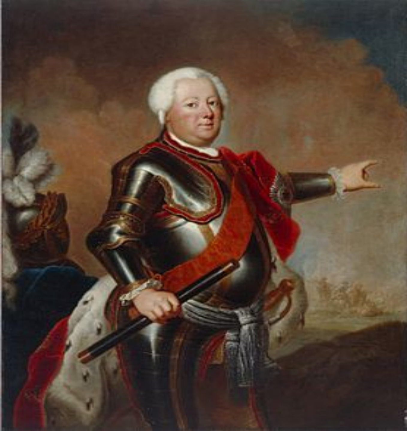
Фридрих Вильгельм I