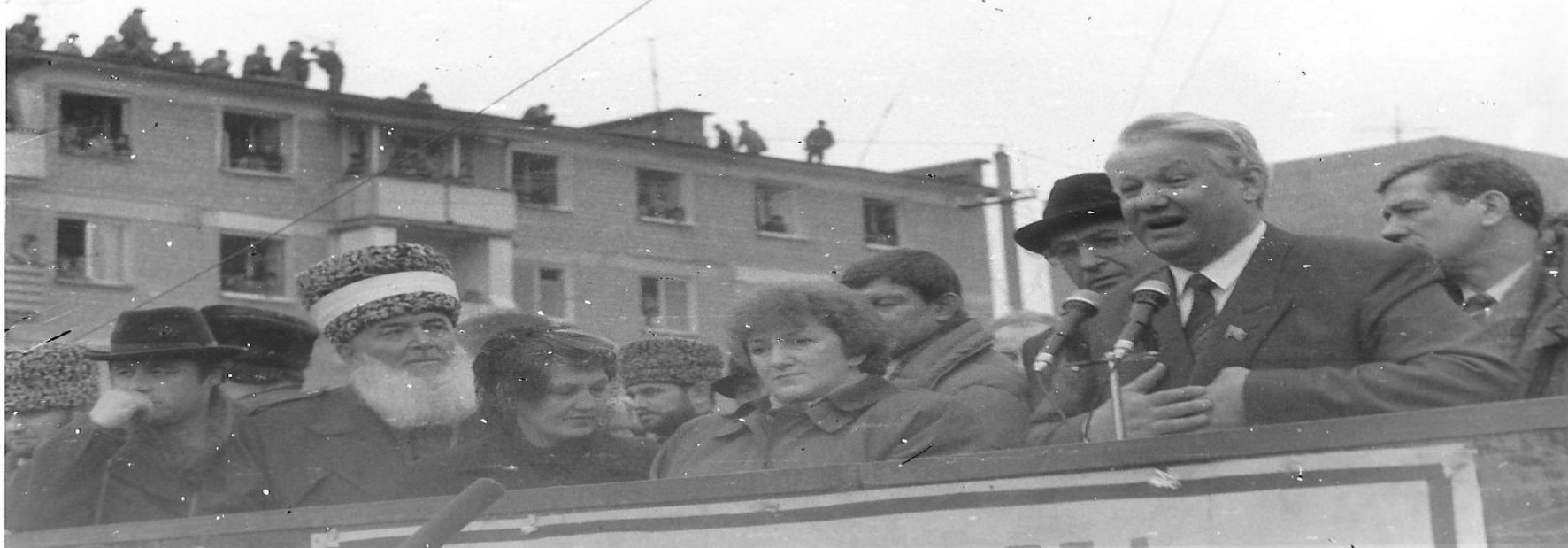
На фото — выступление Бориса Ельцина на митинге в Назрани 24 марта 1991 г. Слева от Ельцина С. Беков, Г. Старовойтова, А. Пошев, Лида Цечоева, Хаджи, М. Долгиев.

23-24 марта 1991 г. Председатель Верховного Совета Российской Федерации Б. Н. Ельцин совершил поездку в Северную Осетию и Чечено-Ингушетию . 24 марта он выступил на многотысячном митинге в г. Назрани с обещанием решить проблему территориальной реабилитации ингушского народа, хотя в целом на митингах в с. Сунжа Пригородного района и г.Владикавказа (23 марта) и 24 марта в Назрани и дал взаимоисключающие обещания.